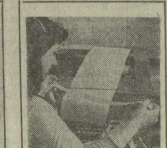
С ТЕЛЕТАШНОЮ ЛЕНТЫ

ВКЛАД НОВАТОРОВ ПРОИЗВОДСТВА Изобретатели и рационализаторы страны вносят большой вклад в развитие экономики республики. Экономия от внедрения изобретений в промышленность ежегодно составляет несколько миллиардов лей. В результате деятельности новаторов произведена удельная вес высокосортных и легированных сталей возрос с 6,3 процента в 1970 году до 9,1 процента в 1975 году. За последние восемь лет Румыния была удостоена на международных выставках изобретений 129 золотых, 40 серебряных и 5 бронзовых медалей. [По материалам Румынского агентства печати Аджерпресс—ТАСС.]