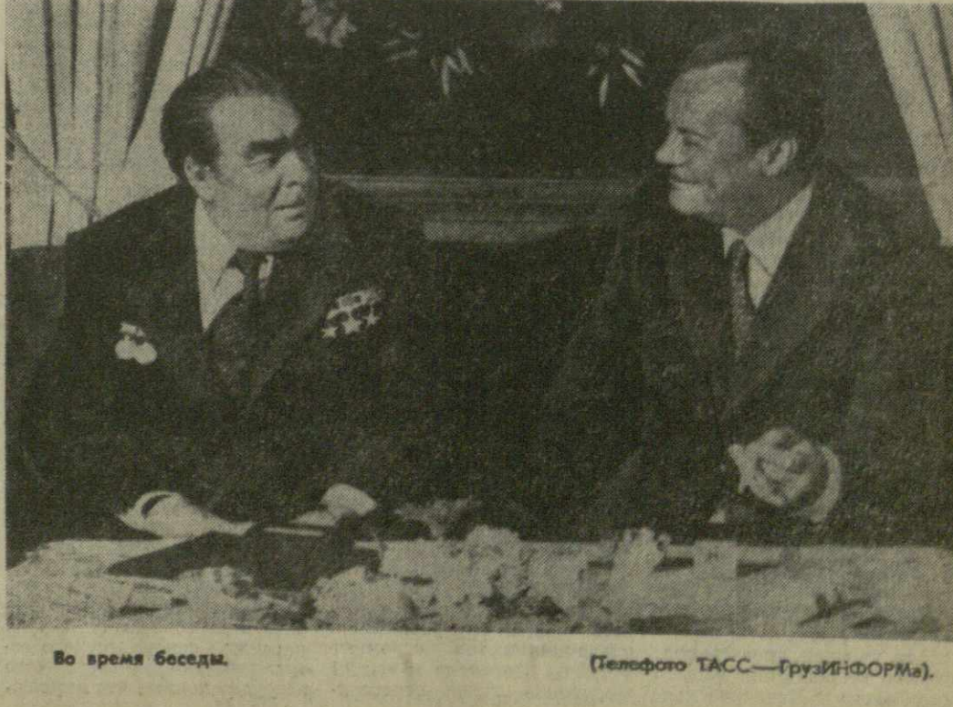
Во время беседы.

и сотрудничества СССР и ФРГ опирается на прочный фундамент Московского договора. Это сотрудничество, как сказал В. Брандт, пользуется поддержкой широких кругов западногерманской общественности, в том числе Социал-демократической партии Германии. Л. И. Брежнев подчеркнул большую роль, которую сыграл В. Брандт как один из создателей восточной политики ФРГ — политики добрососедских отношений и сотрудничества с социалистическими странами. Обе стороны в ходе беседы подчеркнули большое значение для перспектив отношений между СССР и ФРГ и укрепления европейского мира задачи воспитания взаимного уважения и доверия народов обеих стран друг к другу, распространения правдивой, объективной информации в средствах массовой информации о жизни обеих стран и народов. В беседе приняли участие член Политбюро ЦК КПСС, министр иностранных дел СССР А. А. Громыко, помощник Генерального секретаря ЦК КПСС А. М. Александров, А. И. Блатов, федеральный секретарь СДПГ Э. Бар.