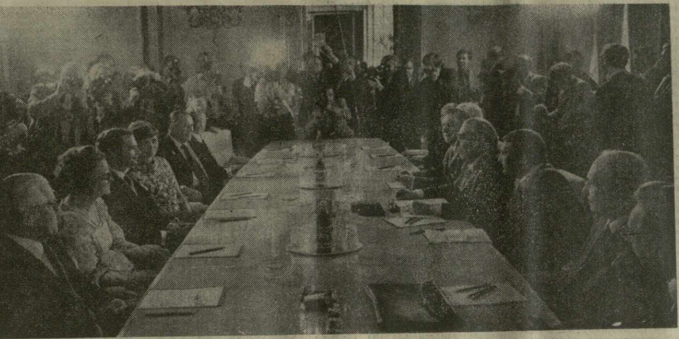
На снимке: во время беседы.

7 июня в Кремле состоялась встреча Генерального секретаря ЦК КПСС, Председателя Президиума Верховного Совета СССР Л. И. Брежнева с королем Швеции Карлом XVI Густавом, находившимся в Советском Союзе с официальным визитом.