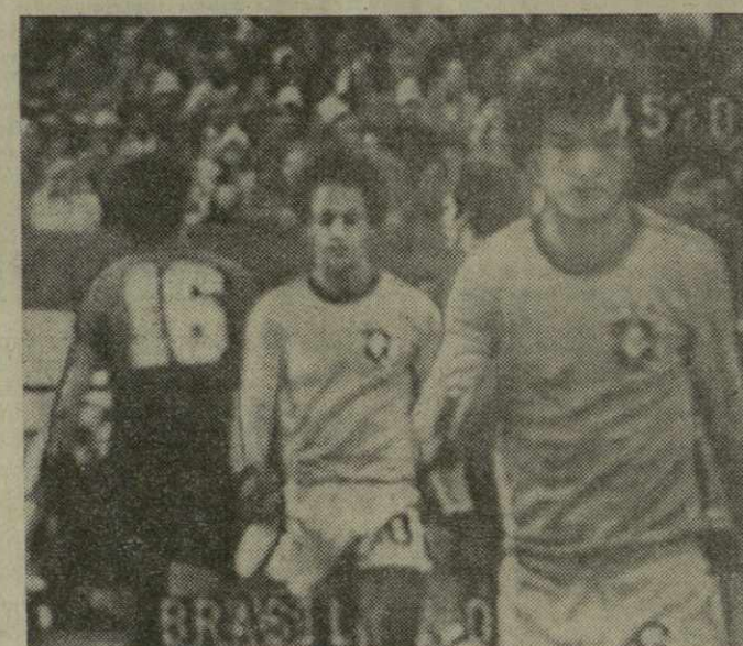
На снимке: нелегким выдался для трехкратных чемпионов мира — бразильцев матч со сборной Испании.

Мяч во встрече Австрия — Швеция забил минутой до перерыва забил лунный бомбардир европейского футбола Кранк. Сделал он это с пенальти.