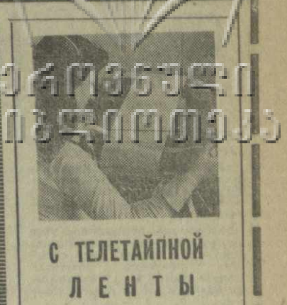
С ТЕЛЕТАЙПНОЙ ЛЕНТЫ

как планы дальнейшего расширения вмешательства НАТО во внутренние дела африканских государств. Речь идет о создании так называемых межафриканских сил, по сути дела карательного экспедиционного корпуса НАТО (куда лишь символически будут входить войска некоторых африканских стран, которые согласны бы играть неблагодарную роль подручных жандармов НАТО).