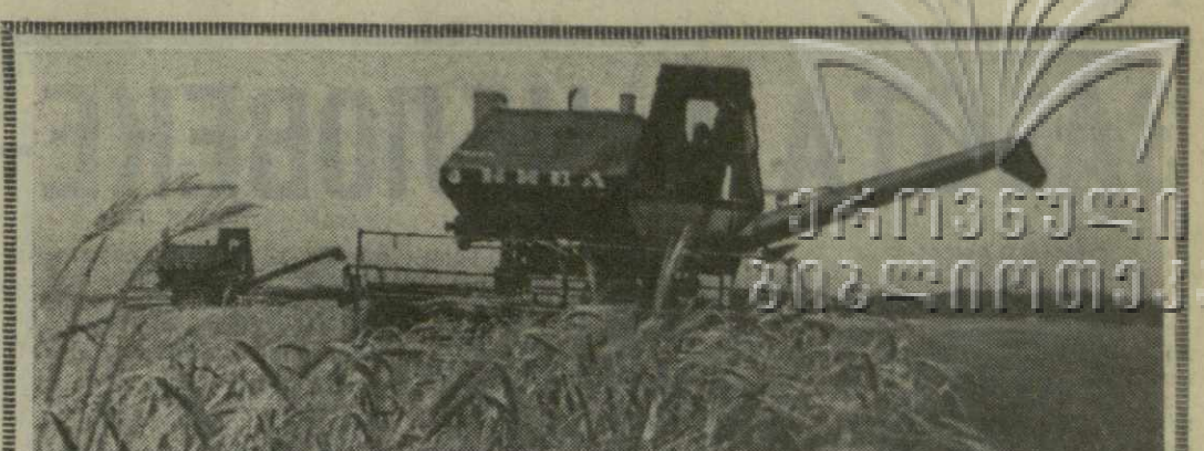
▲ В РЕСПУБЛИКЕ ширится уборка озимых колосовых. К жатве ячменя на днях приступили хозяйства Цителцарского района. На с.и.м.к.: жатва на полях колхоза села Гамадржеба.

№ 139 (16115) • СРЕДА, 14 ИЮНЯ 1978 ГОДА • Цена 2 коп.