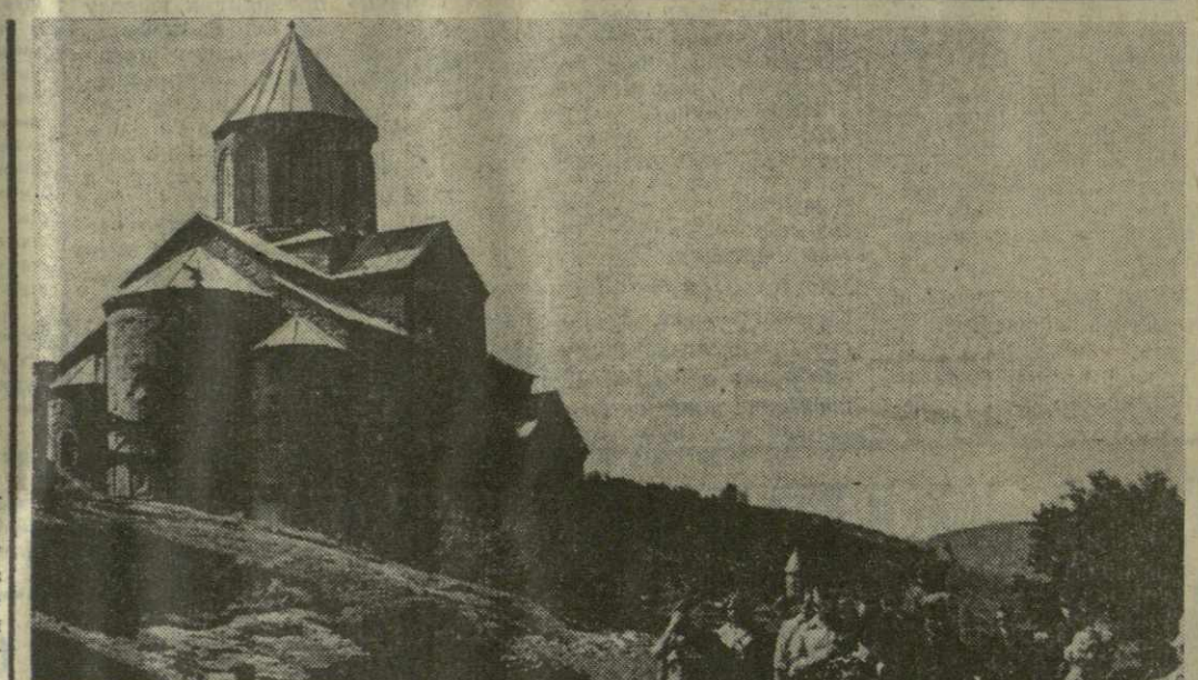
Тбилиси прекрасен в любое время года, а летом — более всего. Неповторимый колорит городу придают старые кварталы — любимое место отдыха тбилисцев и гостей столицы.

На наш взгляд, необходимо как можно лучше познать его с условиями экзаменов, с обстановкой на них, дать необходимые советы, успокоить, уберечь в благожелательном отношении. Этим объясняется, почему так много сейчас работы у наших преподавателей. Консультации проводятся ежедневно.