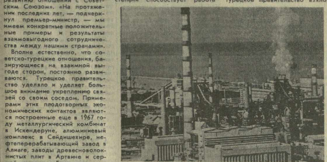
созданной недавно межправительственной советско-турецкой комиссии по экономическому сотрудничеству.

Существенную помощь оказывает Советский Союз турецкому народу в подготовке квалифицированных национальных кадров. В советских учебных заведениях десятки турецких граждан получили специальное техническое образование. А в период строительства промышленных объектов, сооружаемых в сотрудничестве с Советским Союзом на территории Турции, тысячи рабочих овладели новыми профессиями непосредственно на строительных площадках. Их наставниками были советские инженеры и техники. Бесспорно, расширяющиеся экономические связи оказывают благоприятное воздействие и на развитие и укрепление сотрудничества в области техни-