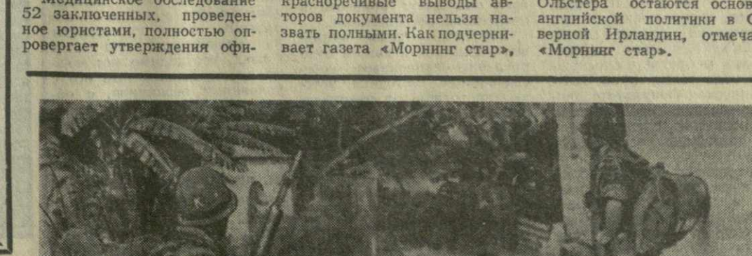
(ТАСС, 19 июня).