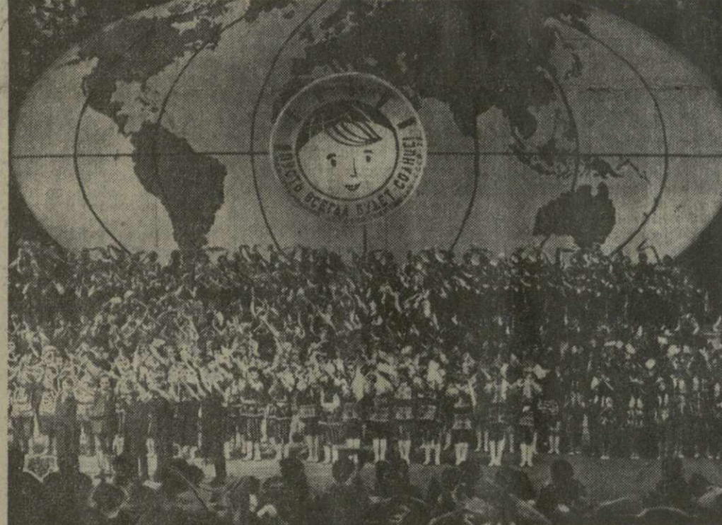
На снимке: во время открытия фестиваля в Кремлевском Дворце съездов.