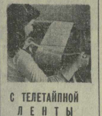
С ТЕЛЕТАЙНОЙ ЛЕНТЫ

ИСЛАМАБАД, 5 августа. (ТАСС). Главный военный администратор Пакистана генерал Зияул Хак вновь подтвердил намерение военных властей передать власть гражданскому правительству после проведения намеченных на октябрь этого года всеобщих выборов.