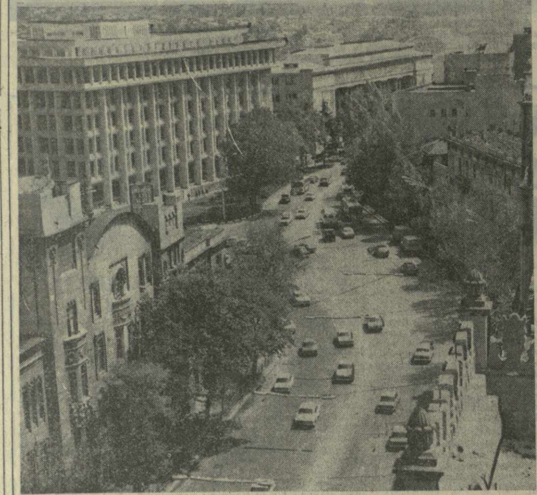
На снимке: Тбилиси. Проспект Руставели.