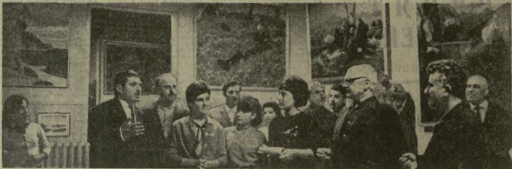
На снимке: в одном из залов музея.