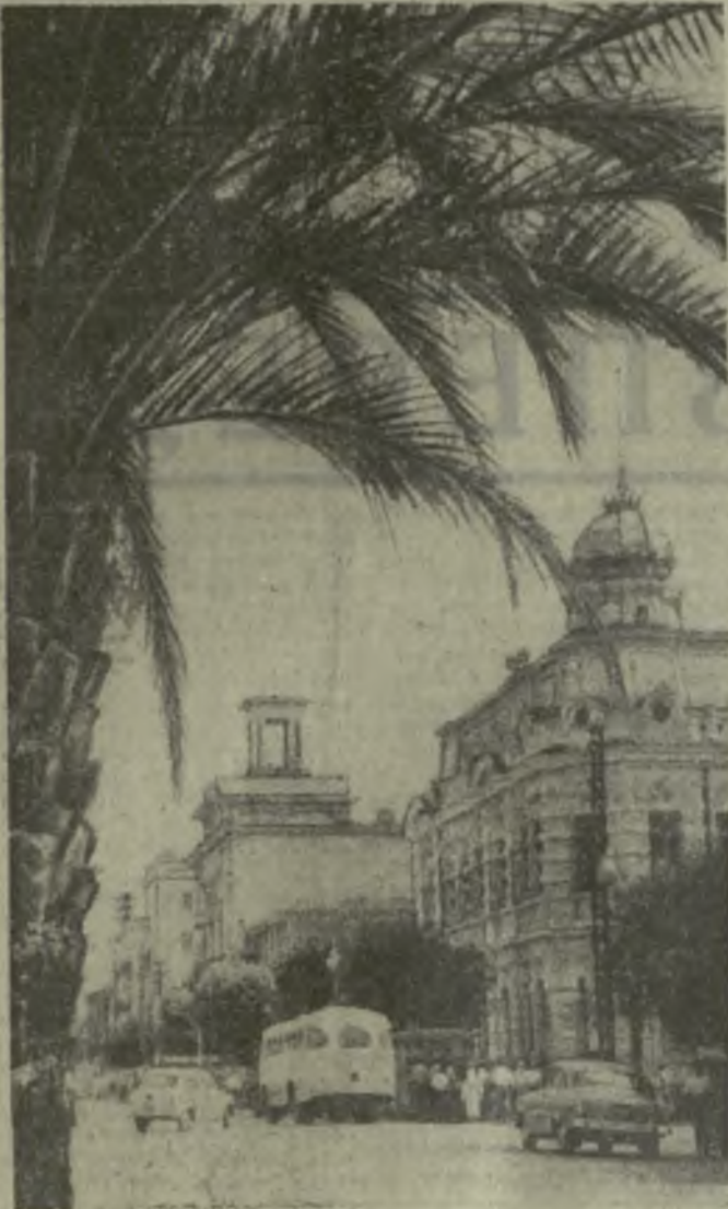
Батуми... Город славных революционных традиций, гордо трудящийся. Во все концы мира отправляются от его портовых причалов грузовые и пассажирские суда. Четок трудовой ритм многоотраслевых заводов и фабрик. Батуми — город-курорт, жемчужина в ожерелье замечательных здравниц Черноморья. На снимке: один из уголков Батуми.

государству на 2 тысячи тонн больше сортового чая, на 6,5 тысячи тонн больше цитрусовых плодов. Итоги работы в первом полугодии нынешнего года дают нам основание с уверенностью сказать, что своей обязательностью, взяты в честь полувекового юбилея Советского государства, трудящиеся Аджарии выполняют с честью. Промышленность республики с большим перевесом реализовала план двух кварталов по выпуску продукции. На 62 процента уже выполнены годовые обязательства наши замечательные чаеводы. С превешением выполнены все виды заготовок сельскохозяйственных и животноводческих продуктов. В эксплуатацию сдан Ватумский домостроительный комбинат с годовой мощностью в 55 тысяч квадратных метров жилой площади. С большой радостью восприняли трудящиеся республики Тезисы ЦК КПСС «50 лет Великой Октябрьской социалистической революции», которые наглядно отражают героический путь, пройденный нашей партией и народом за годы Советской власти, ярко свидетельствуют о величии наших дел и свершений, воодушевляют советских людей на новые героические дела во имя процветания горячо любимой Родины. Праздник пришел на аджарскую землю. Отныне на Государственном флаге Аджарской Автономной Советской Социалистической Республики высшая награда Родины — орден Ленина. Быть достойным этой награды, приумножать славу Отчизны — в этом видит смысл жизни трудящиеся нашей республики, которые вместе со всеми советскими людьми под непобедимым ленинским знаменем идут к сверхающим вершинам коммунизма,