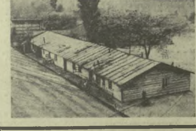
Два снимка. Между ними прошло всего полвека. Срок как будто небольшой, но сейчас даже с трудом верится, что здесь когда-то стояли деревянные наскоро сколоченные хижины. Поднялись вверх кварталы многоэтажных красавцев-домов Кировского станкостроительного. В зеленый наряд оделись улицы.

— КАК вы проводите свободное время? Из ста опрошенных рабочих завода имени Кирова больше половины после работы систематически посещают заводской клуб, бывают на концертах самодеятельности, лекциях. Три раза в неделю здесь демонстрируются кинофильмы. Рабочие по вечерам у себя дома смотрят телевизор, слушают радио, читают газеты, они ходят в кино, театры, посещают выставки. Все опрошенные выписывают по несколько журналов и газет. В среднем — на 20 рублей в год. Все это, на первый взгляд, мелочи, которые мы в своей повседневной жизни привыкли не замечать. Но вот из таких мелочей — столовой, комнаты отдыха, газет и журналов, телевизора и радио — складывается наш быт, и чем лучше он организован, тем культурнее и содержательнее становится жизнь.