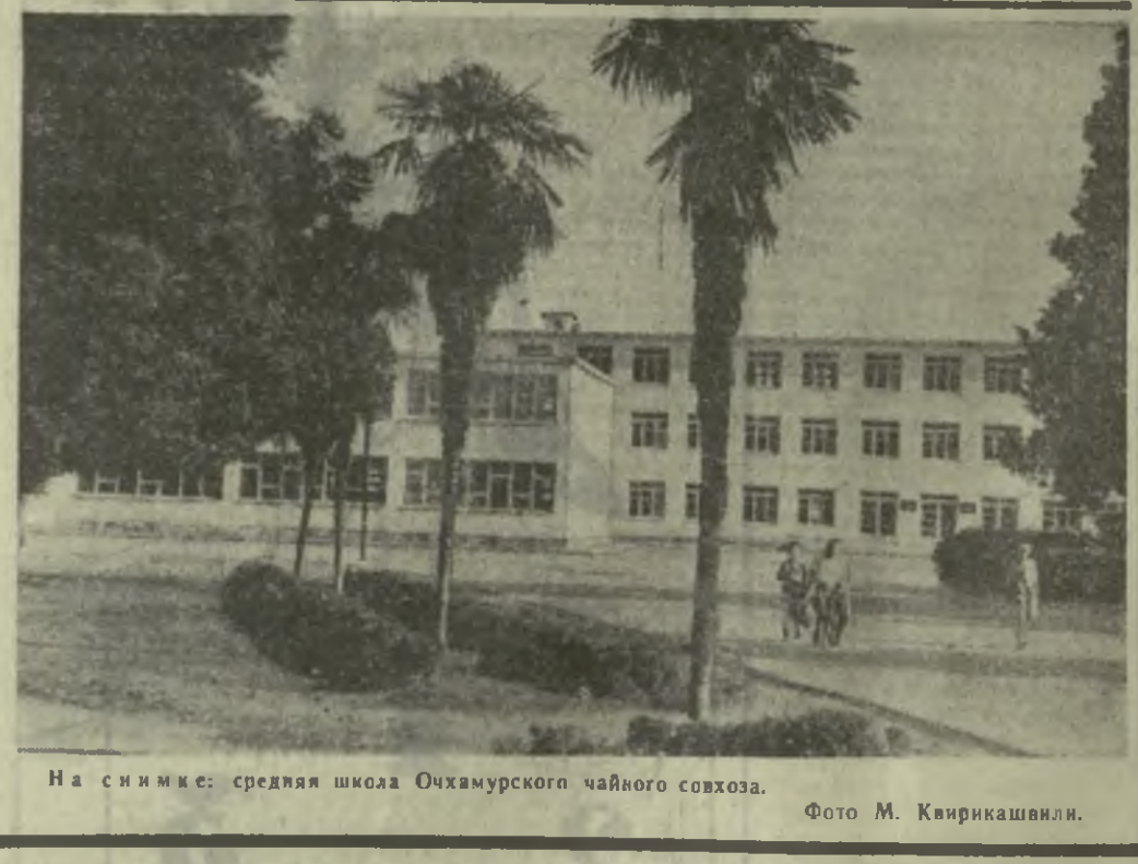
На снимке: средняя школа Очамурзского чайного совхоза.