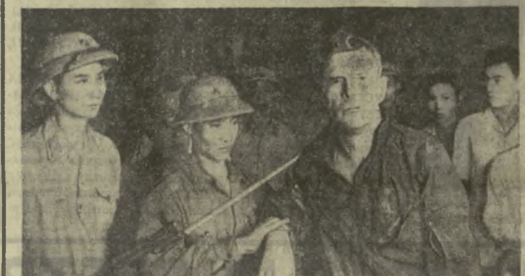
Этот американский летчик больше не будет участвовать в полетах на ДРВ. Метким огнем вьетнамских зенитчиков был сбит его самолет, сам он попал в плен.