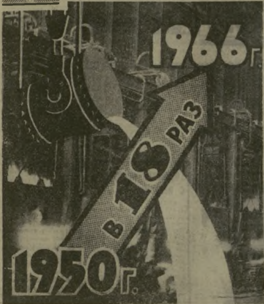
Производство стали в Грузинской ССР в 1966 году по сравнению с 1950 годом увеличилось почти в 18 раз.

На этой диаграмме — лишь один из характерных показателей роста металлургии нашей республики: ПРОИЗВОДСТВО СТАЛИ В ГРУЗИИ УВЕЛИЧИЛОСЬ В 1966 ГОДУ ПО СРАВНЕНИЮ С 1950 ГОДОМ, ПРИМЕРНО, В 18 РАЗ. Для сравнения не случайно взят 1950 год. Именно тогда была выдана первая сталь на новом крупном предприятии республики — Руставском металлургическом заводе.