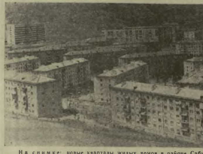
На снимке: новые кварталы жилых домов в районе Сабуртало.