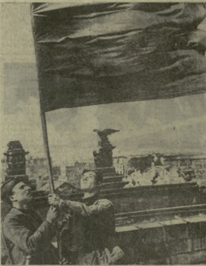
На снимке: Знамя Победы, водруженное над рейхстагом М. Егоровым и М. Кантария.

Вдохновителем и организатором побед Советских Вооруженных Сил над фашистской Германией и империалистической Японией явилась Коммунистическая партия Советского Союза.