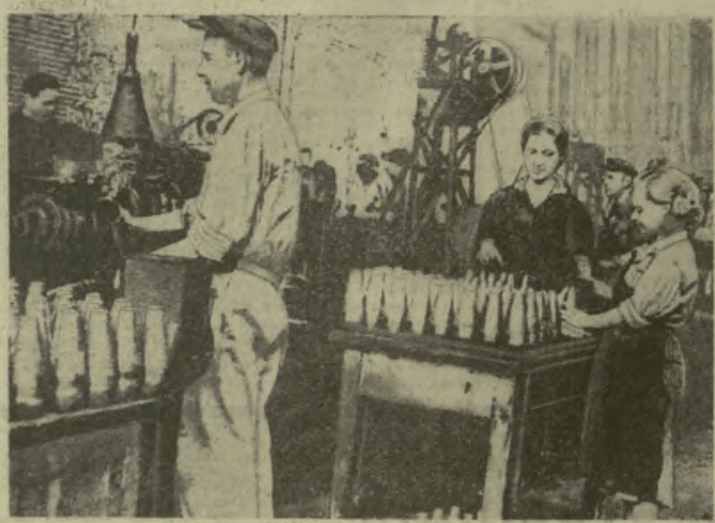
На снимке: выпуск военной продукции на одном из предприятий Грузии. 1944 г.

(Из обращения антифашистского митинга молодежи Закавказья, состоявшегося 27 сентября 1942 г. в г. Тбилиси).