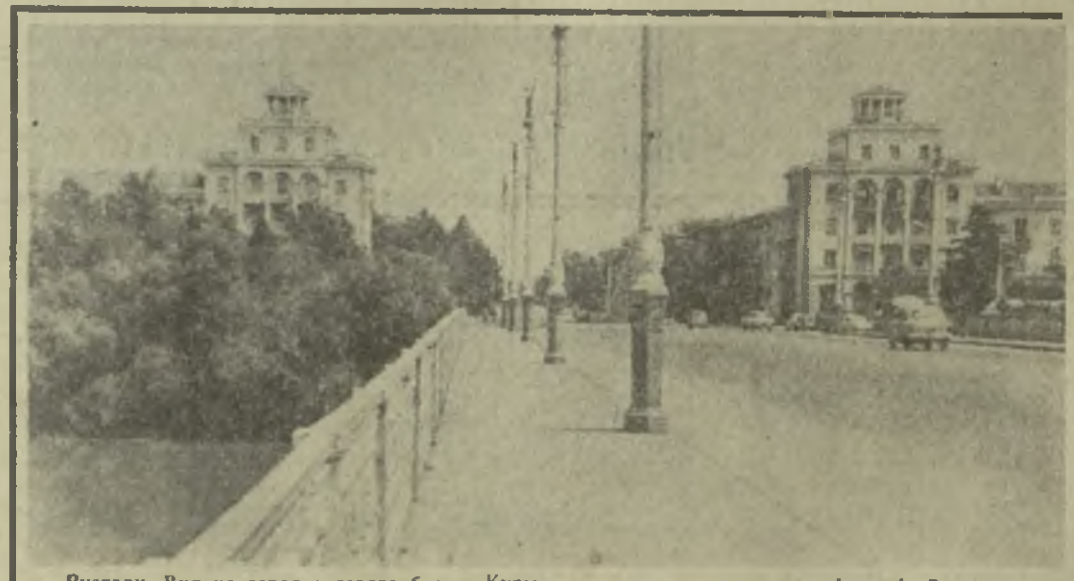
Рустави. Вид на город с левого берега Куры.

представители трех братских национальностей — грузин, русский, армянин. Внизу — сидят женщины-матери с лаверном венком в руках. Памятник сооружен по инициативе и на средства трудящихся района. Он спроектирован архитектором Н. Маргаришвили, скульпторы — Г. Очаури, Т. Тодуа, Ю. Кваташвили, Т. Ломашвили. Работу выполнили каменщики-мастера А. Бекзатын, В. Мардоян, Х. Кочарян, Ж. Манвелан.