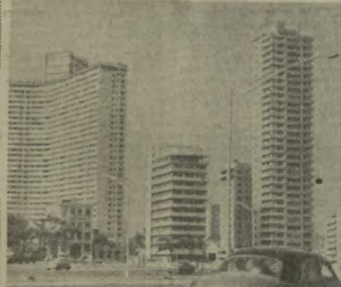
Столица Республики Куба — Гавана. Район Ведадо.

Кубинский народ встречает 14-ю годовщину начала революции замечательными успехами в строительстве новой жизни. До революции Куба была отсталой полукOLONией, являлась фактически аграрно-сырьевым придатком США. Монополии США загребали на Кубе баснословные прибыли. Они составляли от 20 до 40 процентов от вложенного капитала, т. е. срок окупаемости не превышал 3—5 лет. Расплачиваясь за это приходилось трудящимся. Их обирали на нужды и нищету. Острейшей экономической проблемой дореволюционной Кубы была проблема безработицы. Из общего числа рабочей силы в 2,2—2,5 миллиона человек в то вре-