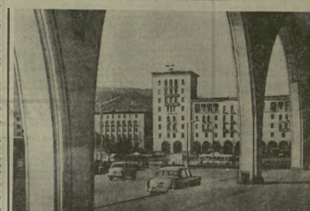
На снимке: один из уголков столицы Грузии — Тбилиси.

Созданный в Советском Союзе прибор облегчает осмотр больных и в послеоперационный период. Он вызвал интерес у многих зарубежных фирм, и внешне торговле объединение «Лицензинторг» организовало продажу лицензий.