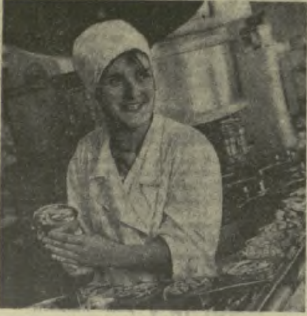
Замечательную трудовую победу одержали труженники Гагрского рыбзавода. Пыугодовой план по выпуску рыбных консервов ими реализован досрочно, стране отгружено 110 тысяч банок рыбных консервов.