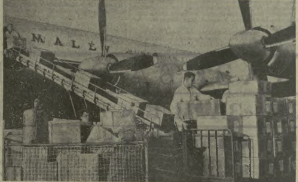
Ветрия, как и другие социалистические страны, направляет в помощь пострадавшим арабам продовольствие, медикаменты и другие товары.

ВАШИНГТОН, 18 июля. (ТАСС). Американские сторонники мира приняли решение выдвинуть своего кандидата на пост президента США на выборах будущего года, заявил вчера известный борец за мир врач-педиатр Бенджамин Спок. С этой целью, сказал Спок, в августе текущего года все американские организации, выступающие за мир во Вьетнаме, проведут в Чикаго национальную конференцию. Негритянский лидер, лауреат Нобелевской премии мира Мартин Лютер Кинг является наиболее подходящим кандидатом на пост президента США, продолжил доктор Спок. Он зачитал заявление Национального комитета борьбы за разумную ядерную политику, в котором говорится, что на следующих выборах эта организация будет энергично поддерживать любого кандидата в президенты, который возьмет на себя обязательство выступить с реальной инициативой для достижения мира во Вьетнаме путем переговоров.