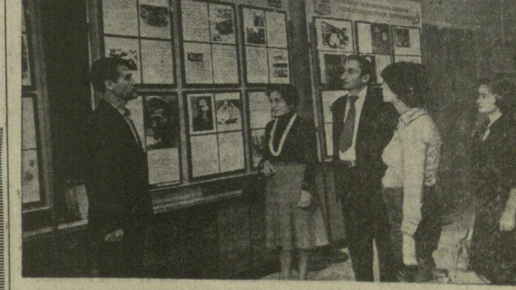
В городах и селах республики отмечается 100-летие со дня рождения Ф. Э. Дзержинского. Повсеместно читаются лекции и доклады о жизни и революционной деятельности рыцаря революции, открыты выставки, проводятся торжественные собрания трудящихся.

«...Воспользовавшись пребыванием на побережье, Ф. Дзержинский знакомится с составом портов Сухуми, Батуми и в дальнейшем проявляет большую заботу о развитии Черноморско-Азовского пароходства. Еще до своего приезда в Грузию, в июне 1922 года, он обратился с письмом в Совет Труда и Оборон РСФСР, в котором обосновывал необходимость скорейшего сверпланового ассигнования 220.000 рублей для срочной организации работ по освоению Военно-Грузинской дороги и Черноморского шоссе. Несколькими позже, будучи председателем Высшего Совета Народного Хозяйства СССР, Ф. Дзержинский содействовал в перероске из разных областей страны в Абхазию оборудования для предприятий пищевой промышленности. Подобных примеров его заботливого отношения к развитию экономики Грузии немало».