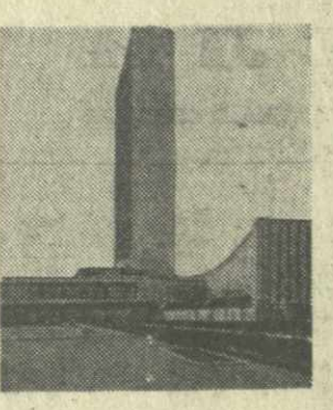
НЬУ-ЙОРК, 8 сентября. (ТАСС). Советский Союз и

другие социалистические страны выступили в ООН с новыми важными предложениями, направленными на обуздание гонки вооружений и разоружение. Делегации социалистических стран совместно внесли на рассмотрение подготовительного комитета по созыву специальной сессии Генеральной Ассамблеи ООН, посвященной разоружению, два важных документа. Они озаглавлены: «Основные положения Декларации по разоружению» и «Основные положения программы действий по