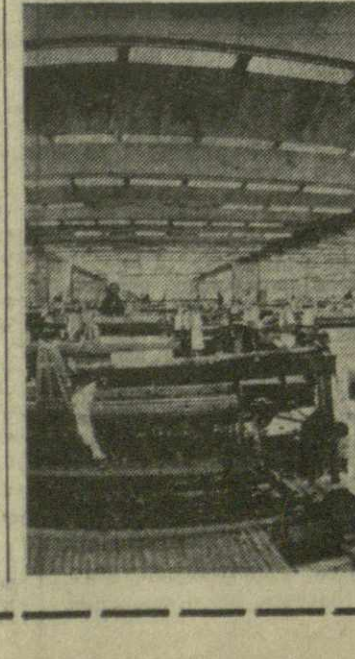
Советских Социалистических Республик.

В своем докладе на XI съезде БКП товарищ Т. Живков заявил: «Мы, болгарские коммунисты, болгарские трудящиеся, весь болгарский народ не представляем себе иного пути развития социалистического общества, а затем и коммунистического общества в Болгарии, кроме как плечом к плечу с нашими советскими братьями и сестрами, в условиях самого тесного и всестороннего сотрудничества с партией Ленина, в условиях все более полного, все более органического сближения НРБ с великим Союзом