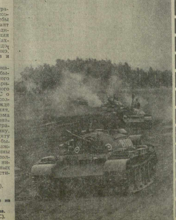
На снимке: танкисты на учениях.

Ежегодно во второе воскресенье сентября Родина чествует своих славных сынов — танковиков, ветеранов танковых войск, создателей могучей боевой техники, всех тех, кто свои знания и труд посвящая делу укрепления боевой мощи одного из основных родов войск Советской Армии. Ныне этот праздник трудящихся Грузии, войны Красной Армии, Закавказского военного округа вместе со всем советским народом встречают в обстановке огромного политического и трудового подъема, вызванного историческими решениями XXV съезда КПСС, маяского (1977 г.) Пленума ЦК КПСС, обсуждением проекта новой Конституции СССР, подготовкой к 60-летию Великого Октября. Советские танковые войска — детище партии, народа. Зародившись в первые дни формирования Красной Армии, они прошли в своем развитии большой героический путь. Из небольших бронетрапов танковые войска стали главной ударной силой наших сухопутных войск. Особенно полно и ярко боевая мощь танковых войск раскрылась в сражениях Великой Отечественной войны.