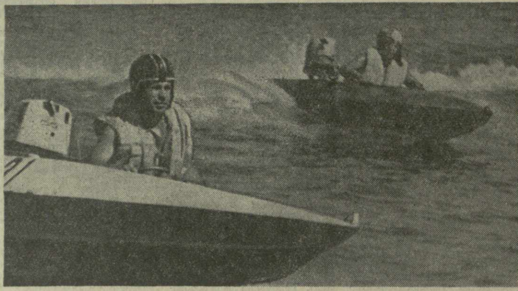
▲ БОЛЬШОЙ ПОПУЛЯРНОСТЬЮ у молодежи пользуется Батумская морская школа ДОСААФ...