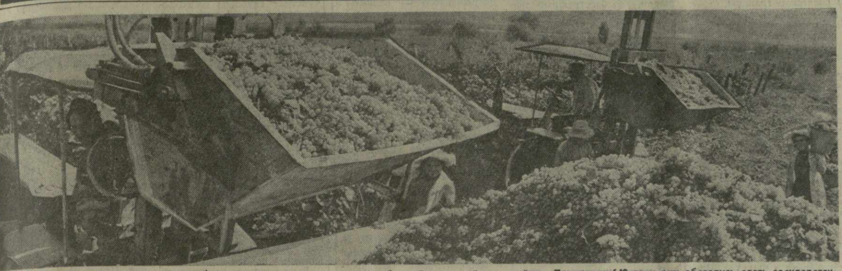
▲ ОТЛИЧНО ТРУДЯТСЯ НА РТВЕЛИ виноградари колхоза села Какабети Сагареджийского района. При плане 640 тонн они обязались сдать государству 1.500 тонн солнечных гроздей и с каждым днем уверенно приближаются к намеченному рубежу. На снимке: ртвели в колхозе села Какабети.

Орган ЦК КП Грузии, Верховного Совета Грузинской ССР и Совета Министров Грузинской ССР № 214 (15886) • ВТОРНИК, 13 СЕНТЯБРЯ 1977 ГОДА • Цена 2 коп.