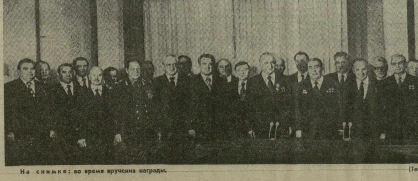
На снимке: во время вручения награды.

В Москве, в Музее К. Маркса и Ф. Энгельса, открылась выставка, посвященная 60-летию Великой Октябрьской социалистической революции. Представленные на стендах документы, фотографии, книги рассказывают о героическом пути, пройденном советским народом за годы Советской страны.