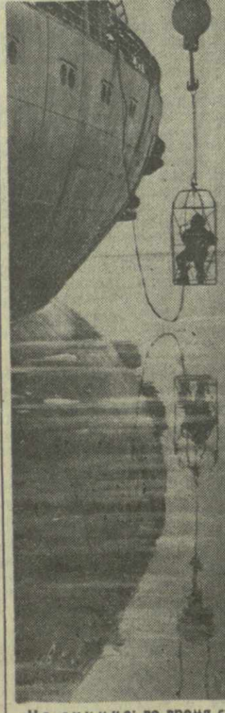
На снимке: во время стоянки атомного ледокола «Арктика» на Северном полюсе был произведен воздушный осмотр винта и лопасти.