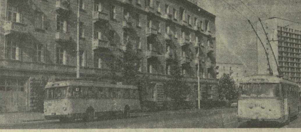
ТБИЛИСИ СЕГОДНЯ. На снимке: проспект И. Чавчавадзе.