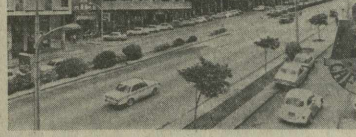
Народная Ангولا уверенно строит новую жизнь. Работают предприятия, крестьяне трудятся на полях сельскохозяйственных кооперативов.

Отмечается, что в ходе переговоров стороны дали высокую оценку развитию дружеских отношений и подтвердили стремление обеих стран к всемерному их укреплению в соответствии с Договором о дружбе и сотрудничестве между СССР и НРА. Были обсуждены узловые проблемы современной международной обстановки. (ТАСС, 29 сентября).