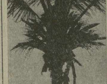
Народная Ангولا уверенно строит новую жизнь. Работают предприятия, крестьяне трудятся на полях сельскохозяйственных кооперативов.

ным, кандидатом в члены Политбюро ЦК КПСС, секретарем ЦК КПСС Б. Н. Пономаревым и Председателем МПЛА, Президентом НРА А. Нето, членом Политбюро ЦК МПЛА, членом Революционного совета НРА, начальником управления ин-