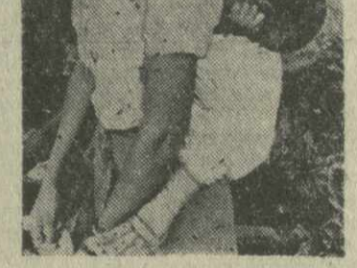
Вакцинация населения в Анголе.

ЯПОНИЯ. «Манитя» обращает внимание на то, что рекомендации к принятию поправки к проекту Конституции СССР были выработаны с учетом предложений советских граждан. Они касаются прежде всего таких областей, как роль труда при социализме, бережливости, собственности и социалистической собственности, дальнейшего развития социалистической демократии.