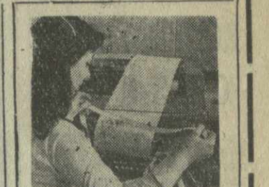
С ТЕЛЕТАЙПНОЙ ЛЕНТЫ

Видный профсоюзный деятель США А. Браун заявил: «На меня произвел большое впечатление подлинно демократический характер процесса разработки новой советской Конституции, которая подвергнута широкому обсуждению по всей стране — в колхозах, на заводах, в учреждениях».