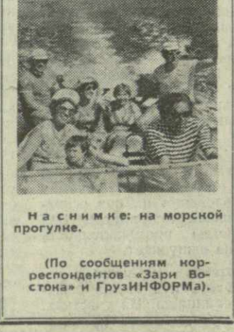
На снимке: на морской прогулке.

В Сочи — одна из популярных здравниц на побережье Черного моря. Отличный климат, благоустроенные пляжи, обильную и отличную отдых курортникам.