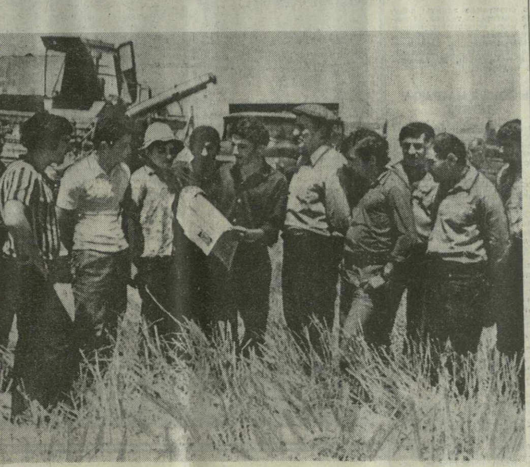
▲ СЕЛЬСКИЕ ТРУЖЕНИКИ республики с большим интересом знакомятся с материалами июльского (1978 г.) Пленума ЦК КПСС.