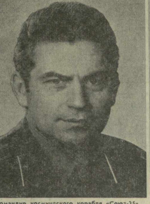
Командир космического корабля «Союз-25» подполковник Владимир Васильевич Коваленок.

10 октября в 7 часов 09 минут было начато автоматическое сближение корабля «Союз-25» со станцией «Салют-6», и затем с расстояния 120 метров проводилась причаливание. Из-за отклонений от предусмотренного режима причаливания стыковка была отменена. Экипаж начал подготовку к возвращению на Землю. Орбитальная научная станция «Салют-6» продолжает полет.