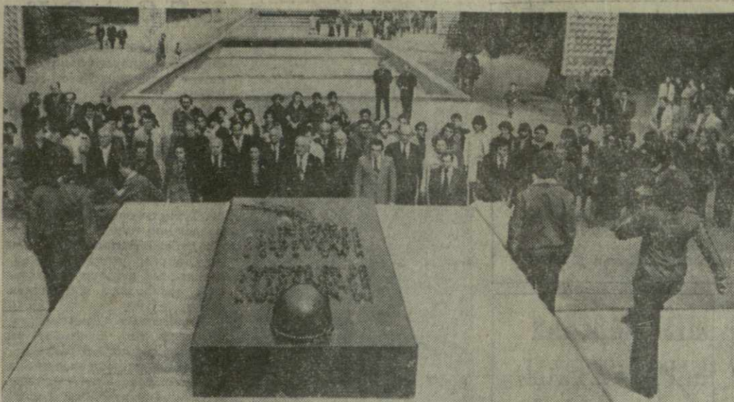
С волнением шли члены делегации Абхазской АССР — участники Дней автономной республики в Тбилиси к могиле Неизвестного солдата в парке Победы. В торжественной тишине делегация возложила венок на могилу Неизвестного солдата, отдавшего жизнь за свободу нашей Родины.