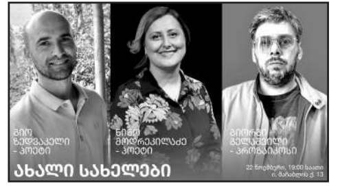
მოსმინოთ მათი შემოქმედება და დაუსვათ თქვენთვის საინტერესო შეკითხვები. დასწრება თავისუფალია.