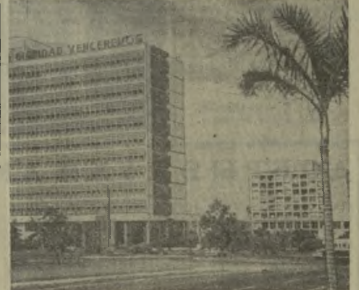
На снимке: г. Гавана — столица Республики Куба.

ХАНОЙ, 30 декабря. (ТАСС). Южновьетнамские патриоты 20 декабря провели смелую операцию по уничтожению американских самолетов, базировавшихся на военном аэродроме близ провинциального центра Каятхо. Агентство ВИА, сославшись на сообщение агентства Освобождение, пишет, что все 27 американских самолетов, находившихся на аэродроме, были уничтожены. Решительной атакой патриоты обратили в бегство охрану аэродрома, состоявшую из четырех рот солдат марнонотенских войск и взвода американских интервентов.