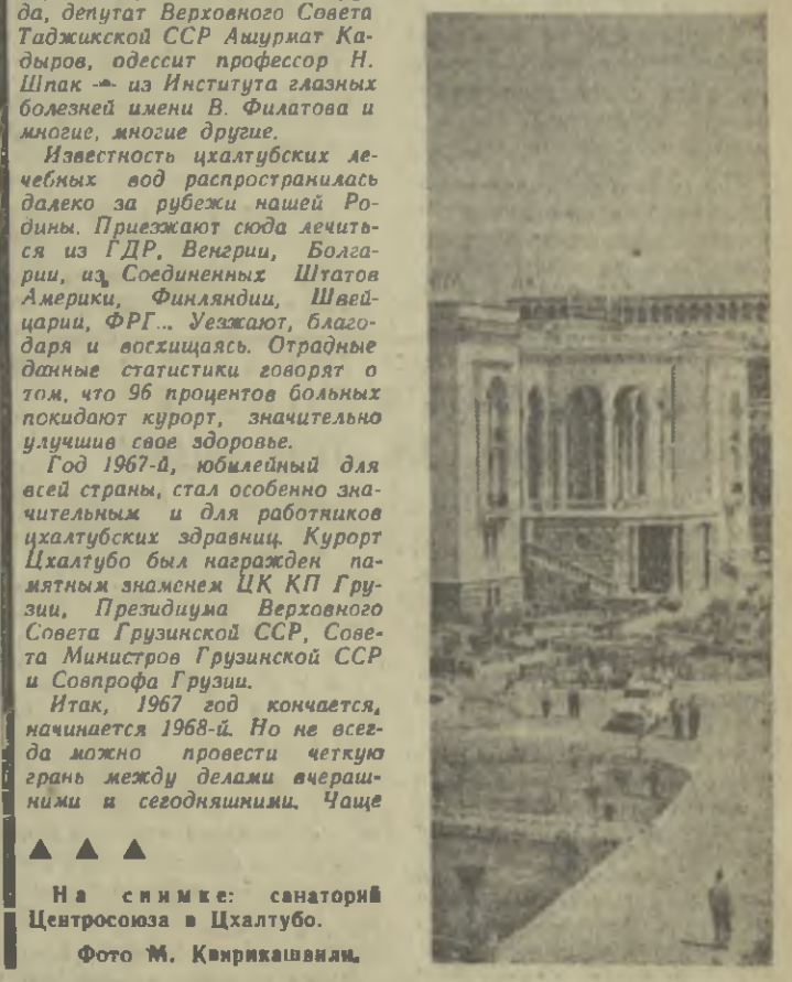
На снимке: санаторий Цвентросоюза в Цхалтубо.

У просторного парадного подвезда многолюдно уже с утра. Звуки шагов входящих в здание томят в ковровых дорожках. Смолкает молодое дыхание. Тишина охраняет здесь царство мысли.