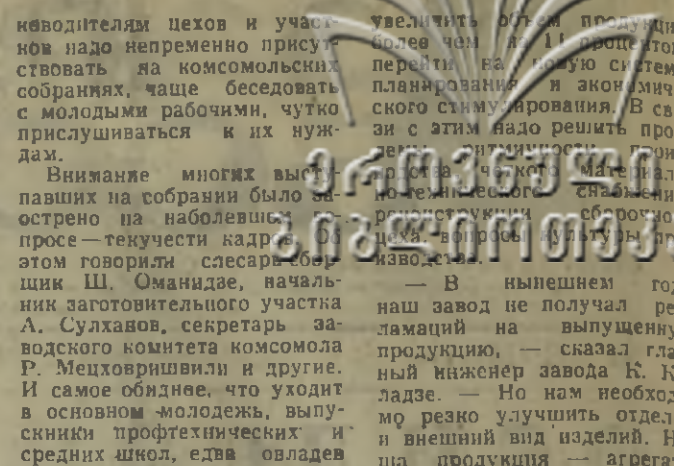
увеличить объем продукции более чем на 11 процентов, перейти на новую систему планирования и экономического стимулирования. В связи с этим надо решить проблему повышения качества изделий.

Однако большие задачи, стоявшие перед коллективом в новом году, требуют неустанного повышения бое-