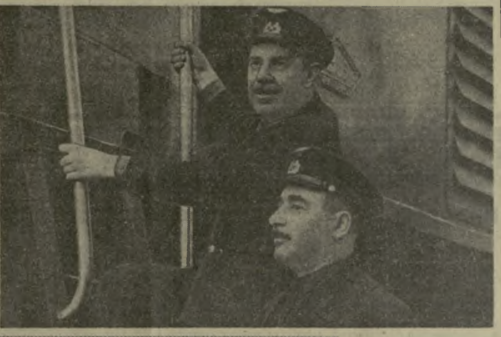
О. НИКАБАДЗЕ. (Корр. «Заря Востока».)

Сегодня руда, добытая калининцами, мощным потоком вливается в богатства страны. Она широко используется в металлургической, химической и других отраслях промышленности, добившихся невиданного развития за годы Советской власти.