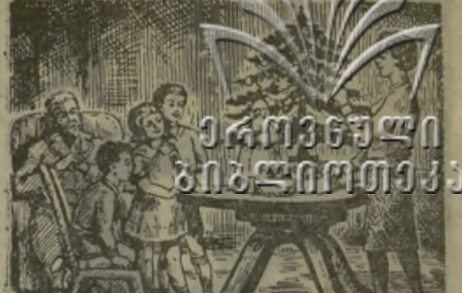
Елка в домашнем кругу.