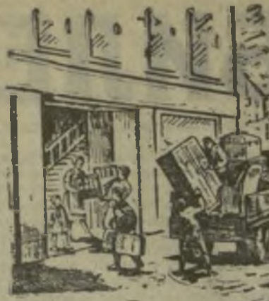
На новую квартиру.