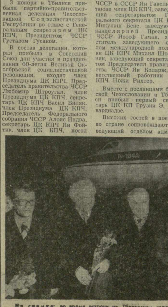
На снимке: во время встречи на Тбилиском аэродроме.

Тысячи тбилисцев вышли на празднично украшенные улицы города, чтобы горячо приветствовать партийно-правительственную делегацию ЧССР, выразить свои чувства к народам братской дружбы с народами Чехословакии. (ГрузинФОРМ).