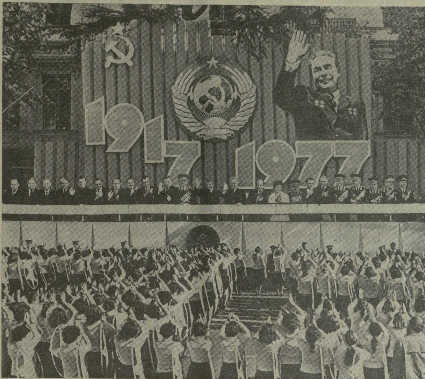
ТБИЛИСИ. 7 ноября 1977 года. Празднование 60-й годовщины Великой Октябрьской социалистической революции. На снимке: на центральной трибуне.

Далее командующий отмечает, что боевые цели ленинской внешней политики Советского Союза — политика мира и дружбы народов, сплочения всех сил, борющихся против империализма, реакции и войны, четко и ясно сформулированы в новой Конституции СССР. Миротворческие инициативы нашего государства получили широкое признание трудящихся всех стран.