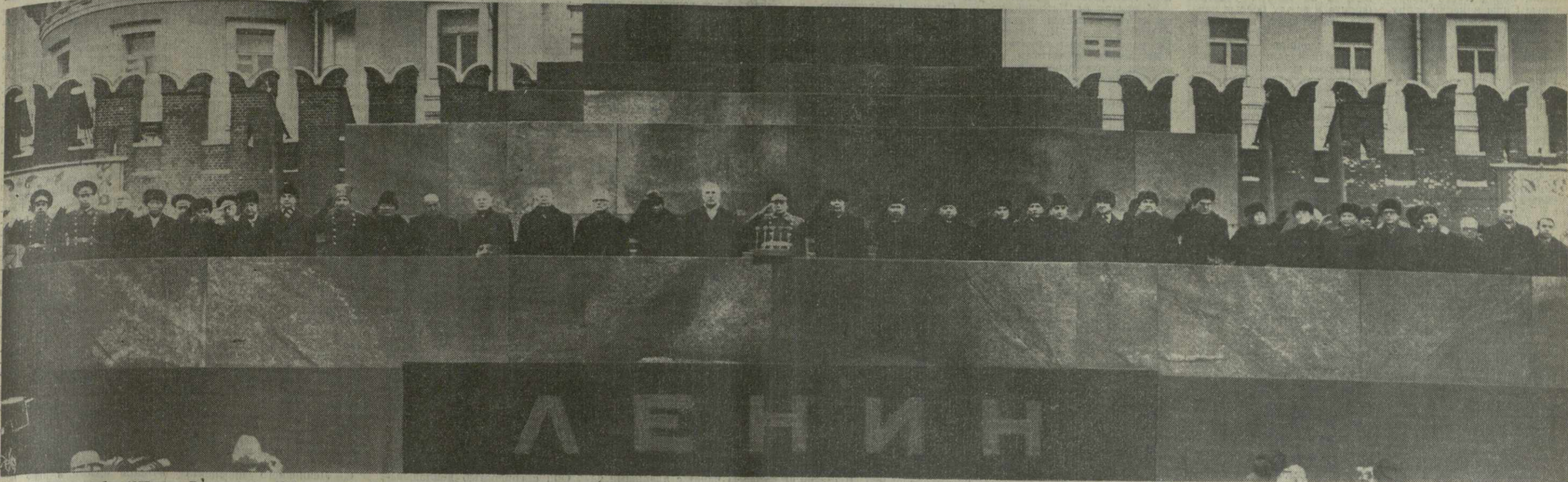
МОСКВА. 7 ноября 1977 года. Празднование 60-й годовщины Великой Октябрьской социалистической революции. На трибуне Мавзолея В. И. Ленина.