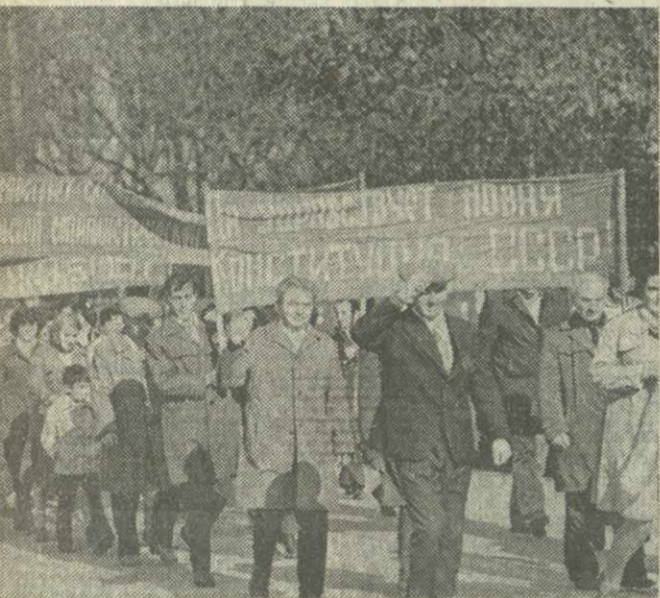
На снимках: демонстрация представителей трудящихся в Сухуми, Батуми и Цхинвали. (Фотокорреспондент ГРУЗИНФОРМА).