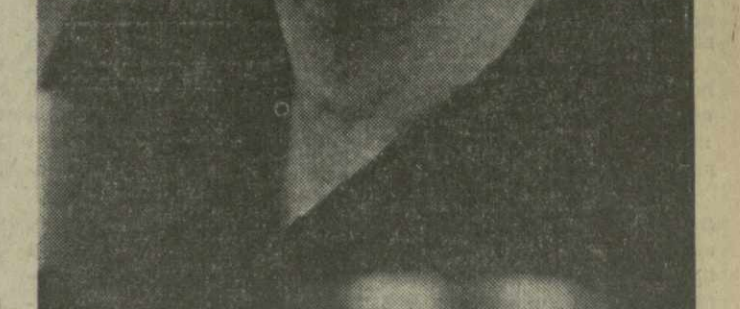
Не снижая темпов