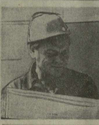
[ТАСС, 14 ноября].