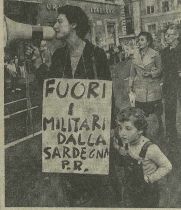
▲ ИТАЛИЯ. Ликвидация американских военных баз на острове Сардиния потребовала участия демонстраций, состоявшейся в Риме.

ЛОНДОН. 15 ноября. (ТАСС). Завершил работу очередной XXXV съезд Коммунистической партии Великобритании, который принял новый вариант программы КПВ «Путь Британии к социализму».