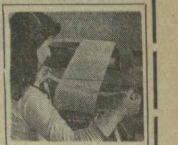
С ТЕЛЕТАЙПНОЙ ЛЕНТЫ

В приветствии участникам встречи президента США Дж. Картера говорится, что американское правительство решительно поддерживает