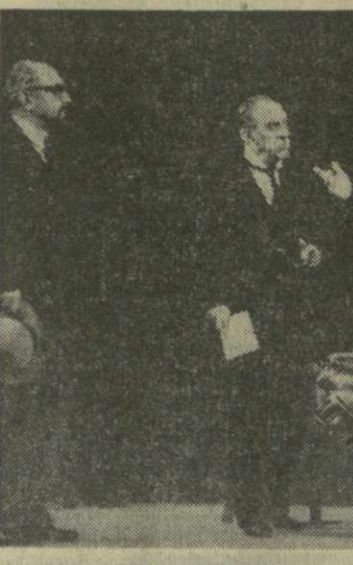
На снимке: сцена из спектакля «Шестое июля».

Спектакль «Шестое июля» впечатляет своим общим настроением, передает революционный дух событий шестидесятилетней давности. Э. ГАЛУСТОВА.