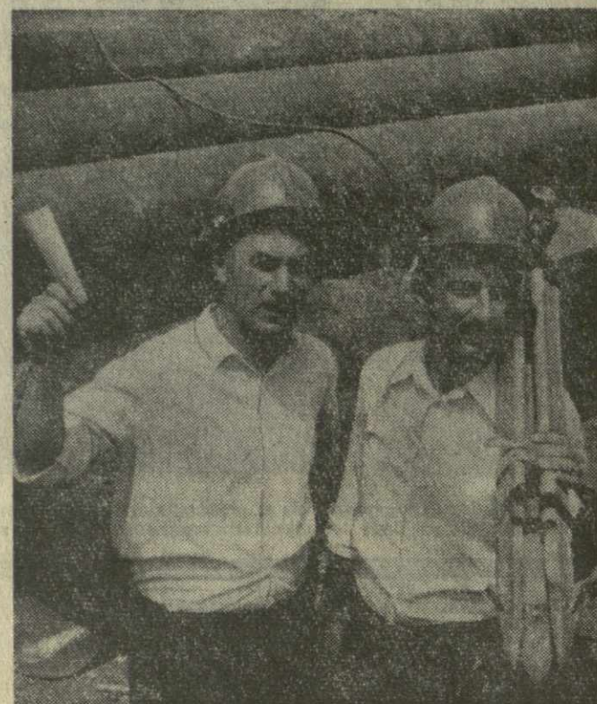
ПРОБЛЕМА ОЧИСТКИ РЕКИ КВИРИЛА долгое время была в центре внимания ученых и специалистов. Теперь она решена. Близ Чиатура начато строительство очистных сооружений...