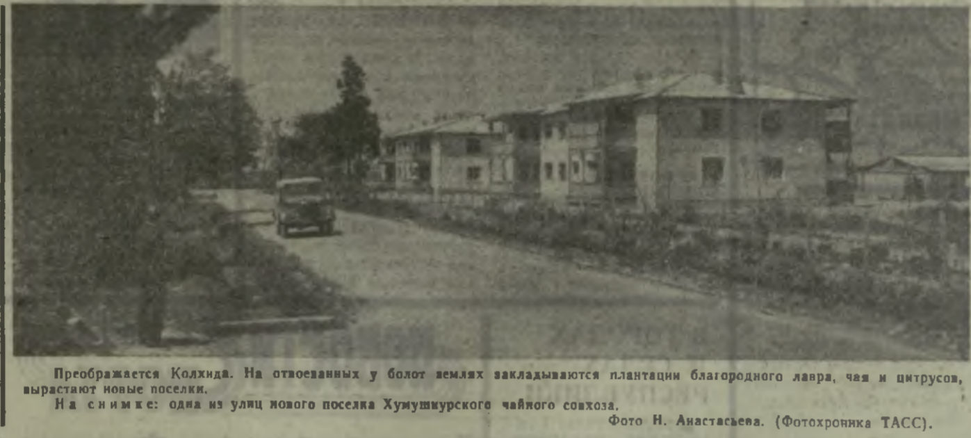
Преображается Колхидя. На отвоеванных у болот землях закладываются плантации благородного лавра, чая и цитрусов...