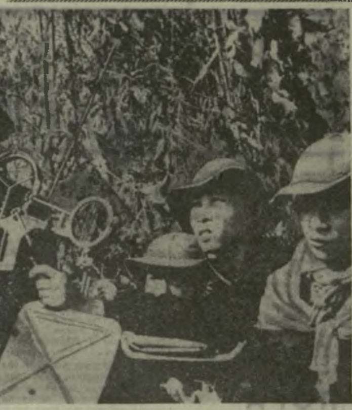
Южный Вьетнам. Бойцы Армии освобождения на боевой позиции.

АНТИВОЕННОЕ ДВИЖЕНИЕ В США УСИЛИВАЕТСЯ ТРАГЕДИЯ НЕ ДОЛЖНА ПОВТОРИТЬСЯ