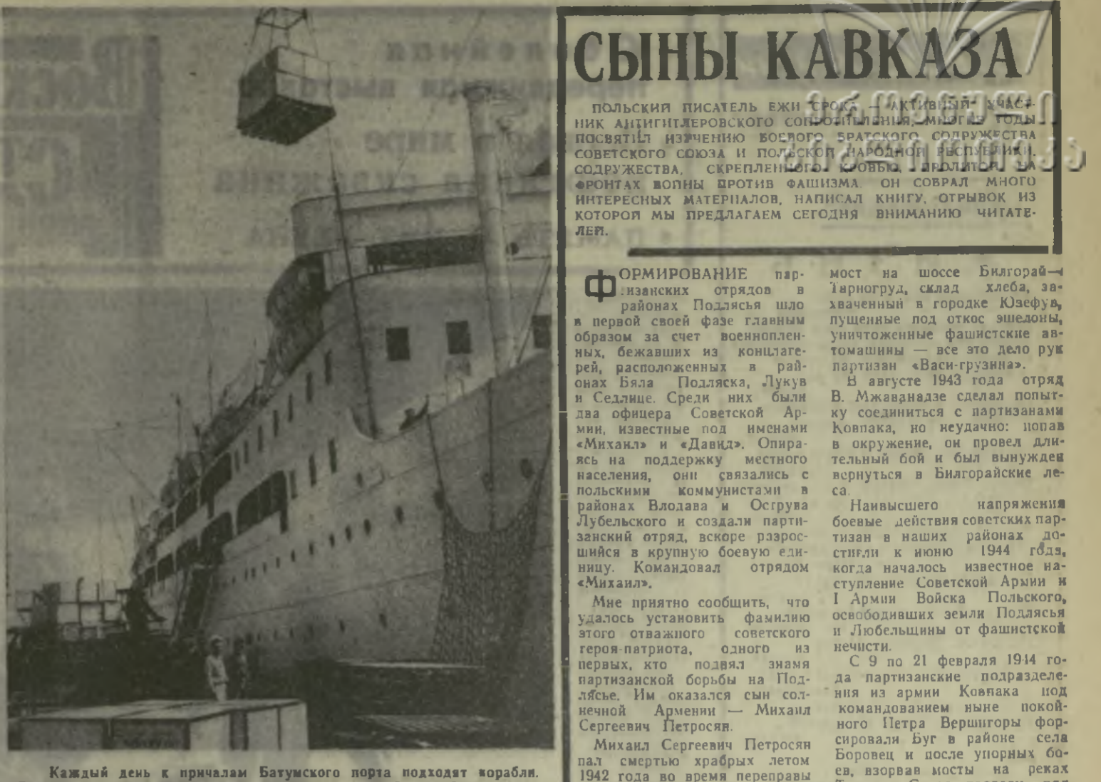
Каждый день к причалам Батумского порта подходят корабли. Во многие страны мира увозят они грузы из нашей республики...