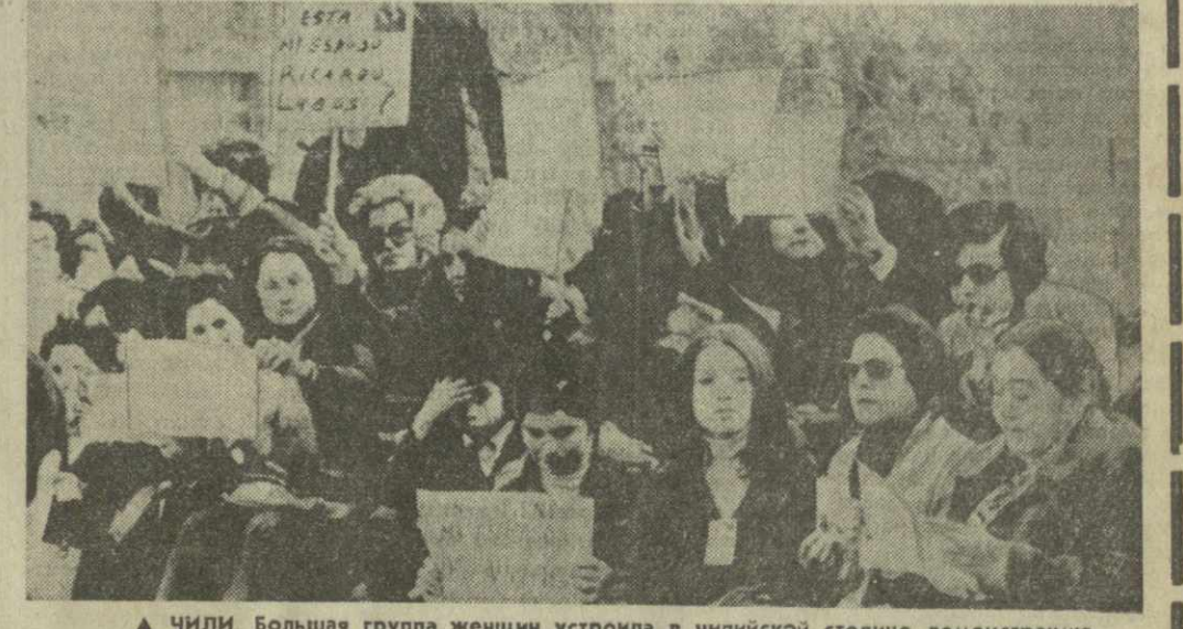
Чили. Большая группа женщин устроила в чилийской столице демонстрацию, потребовала от клики Пиночета сообщить о судьбе их близких, бесследно «исчезнувших» в застенках пиночетовской охраны. Ничего не сообщая об участии 2.500 разъяренных патриотов, хунта нагло отрицает факт их ареста и цинично заявляет о своей «непричастности» к их исчезновению.