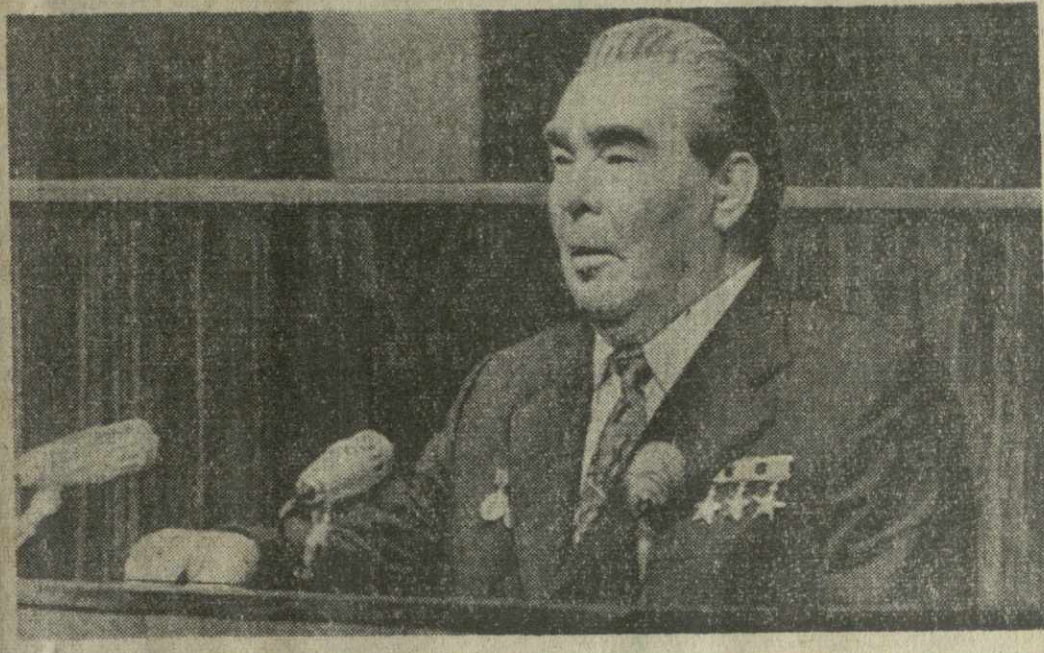
БАКИНСКОГО ГОРКОМА ПАРТИИ И ГОРОДСКОГО СОВЕТА НАРОДНЫХ ДЕПУТАТОВ СОВМЕСТНО С ПРЕДСТАВИТЕЛЯМИ ПАРТИЙНЫХ, ОБЩЕСТВЕННЫХ ОРГАНИЗАЦИЙ, ТРУДОВЫХ КОЛЛЕКТИВОВ И ВОИНСКИХ ЧАСТЕЙ, ПОСВЯЩЕННОЕ ВРУЧЕНИЮ СТОЛИЦЕ АЗЕРБАЙДЖАНА ОРДЕНА ЛЕНИНА.