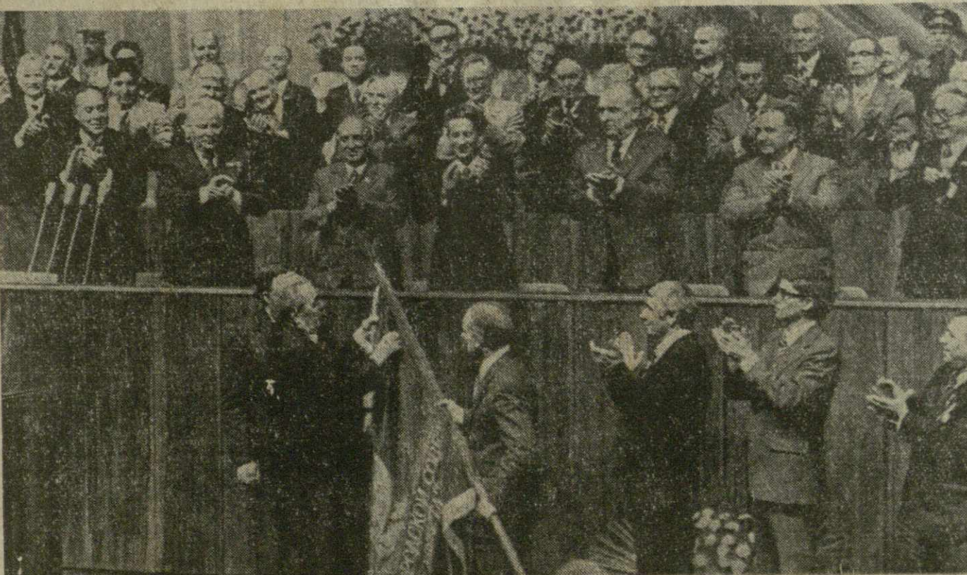
На снимке: во время вручения награды.