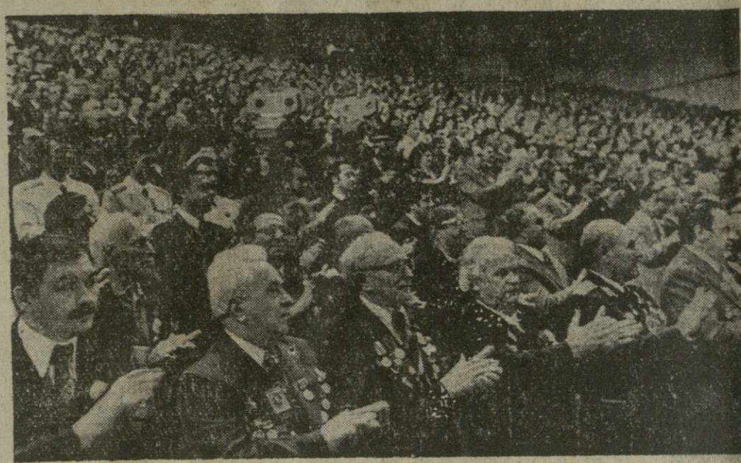
БАКУ. 22 сентября во Дворце имени В. И. Ленина состоялось торжественное заседание Бакинского горкома партии и городского Совета народных депутатов совместно с представителями партийных, общественных организаций, трудовых коллективов и воинских частей, посвященное вручению столице Азербайджана ордена Ленина.

БАКУ 22 сентября. (Спец. корр. ТАСС). За заслуги в революционном движении, установлении и упрочении Советской власти в Азербайджане, большой вклад в победу над фашистскими захватчиками в Великой Отечественной войне 1941—1945 годов и за успехи, достигнутые трудящимися в хозяйственном и культурном строительстве, город Баку награжден орденом Ленина. Сегодня во Дворце имени В. И. Ленина состоялось торжественное заседание Бакинского горкома партии и городского Совета народных депутатов совместно с представителями партийных, советских, общественных организаций, трудовых коллективов и воинских частей, посвященное вручению городу Баку высокой награды Родины. В зале собрались члены и кандидаты в члены ЦК Компартии Азербайджана, депутаты Верховных Советов СССР и Азербайджанской ССР, знатные производственников, передовики сельскохозяйственного производства республики, деятели науки и культуры, ветераны ленинской партии, представители общественных организаций. По залу прокатываются горячие овации, звучат здравницы в честь КПСС, ее ленинского Центрального Комитета, великого советского народа-союзника. Это собрание с исключительной серьезностью встречают Генеральный секретарь ЦК КПСС, Председатель Президиума Верховного Совета СССР Л. И. Брежнев. В президиуме торжественного заседания — кандидат