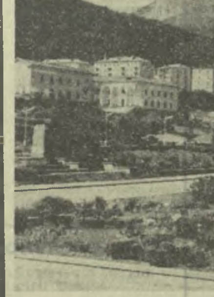
Год от года намечается облик Тбилиди — города «черного золота». От грязного, запыленного поселка дореволюционных лет не осталось и следа. На его месте возник крупный культурный и экономический центр целого района. Современная архитектура, широкие проспекты и улицы, новые жилые массивы — таков сегодня Тбилиди. На снимке: центральная часть города Тбилиди.

В Цулунидзевском районном Доме культуры устроен стенд, посвященный 50-летию Великого Октября. Здесь отображены успехи в развитии сельского хозяйства, промышленности и культуры района за годы Советской власти. Лекторы райкома партии и общества «Знание» читают для населения лекции на темы: «Борьба В. И. Ленина за создание партии нового типа», «Великая Октябрьская социалистическая революция — начало новой эры в истории человечества», «Повышение благосостояния народа за годы Советской власти» и другие. В кабинете политического просвещения Цулунидзевской райкомхоза-рубрики в о и ф. Фабрики состоялась теоретическая конференция, посвященная 50-летию Великого Октября.