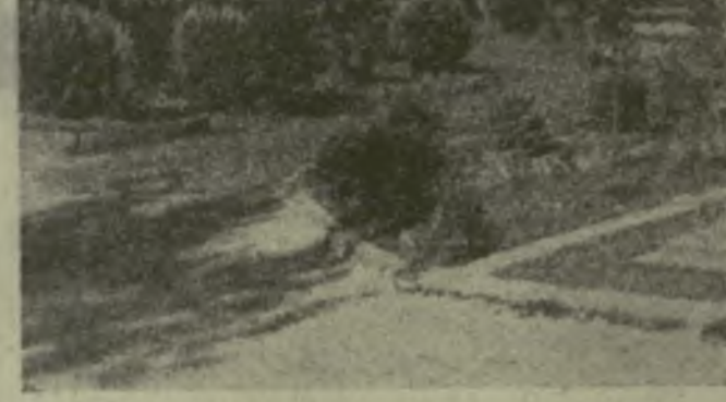
Один из уголков районного центра Вани.

На чемпионате Европы по гребле на байдарках и каноэ успешно выступили советские спортсмены.