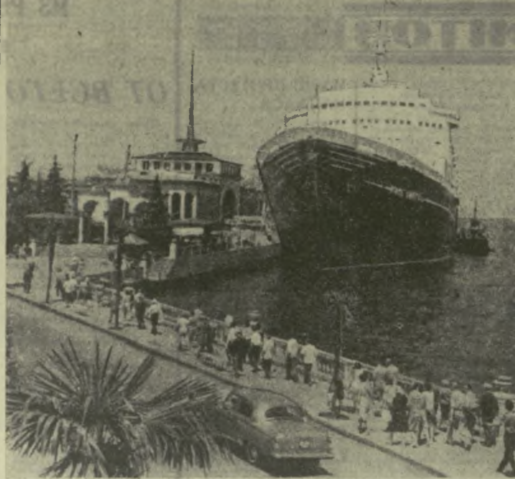
Красива батумская набережная в районе порта. Величествен вид океанских лайнеров, стоящих у его причалов.

Воспитание молодежи на боевых революционных, боевых и трудовых традициях старшего поколения — главная задача, которую выполняет совет ветеранов комсомола при Ленинском райком комсомола Тбилиси.