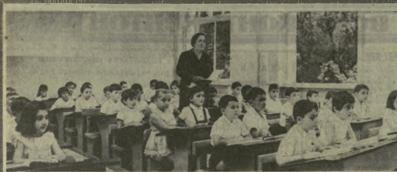
ЗАНЯТИЯ В ШКОЛАХ НАЧАЛИСЬ