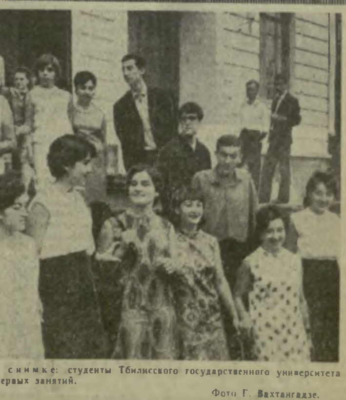
На снимке: студенты Тбилисского государственного университета после первых занятий.

Организовано прошел первый день учебы в 1-й, 2-й, 14-й, 19-й и ряде других школ города Сухуми. Р. БЕРИДЗЕ. Д. ШЕЛИЯ.