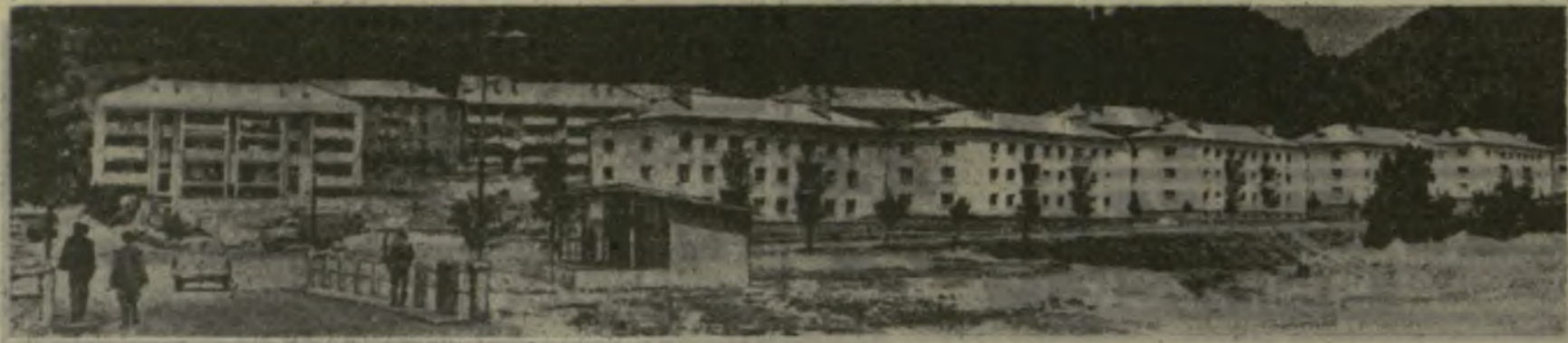
Иллюстрация достижений промышленности...