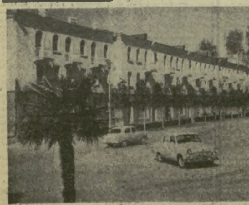
На снимке: новый жилой дом в Цулукидзе.

Сегодня в финском городе Турку состоится ответный матч чемпионата Европы по футболу между сборными командами Советского Союза и Финляндии.