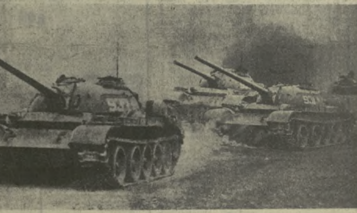
ТАНКИ НА МАРШЕ...