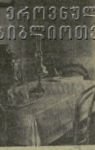
началом новой эры в истории человечества — эры крушения капитализма и утверждения коммунизма.

События так наступали, торопили, что Владимир Ильич решил не дожидаться возвращения Фонаровой. В опроведении съезда ЦК Эйно Рахья он направился в Смольный, возглавил октябрьский штурм, ставший