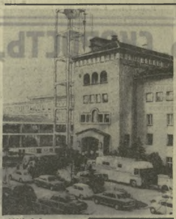
СФОРУ. В Белграде начала работу новая телестудия. Она оснащена самым современным оборудованием. На снимке: здание телестудии в Белграде.

Сообщение У Тапа НЬЮ-ЙОРК, 9 сентября. (ТАСС). Генеральный секретарь ООН У Тан объявил, что 18 сентября возобновит работу чрезвычайная специальная сессия Генеральной Ассамблеи ООН, чтобы продолжить обсуждение ближневосточного кризиса, созданного в результате израильской агрессии.