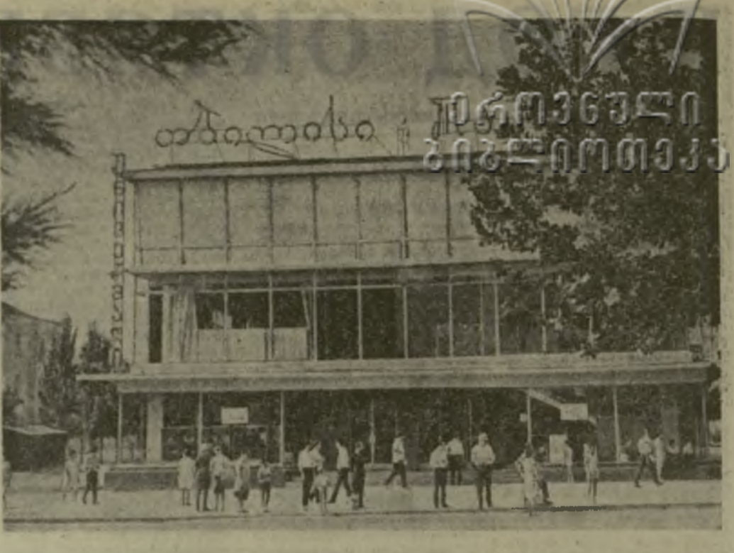
Рустави. Новый универсальный магазин «Тбилиси».

Как передает импрессионно ансамбль народного танца Грузии под руководством народных артистов СССР Н. Рамшвили и И. Сухишвили, гастроль ансамбля проходит в Ирландии с большим успехом. На одном из концертов присутствовали премьер-министр Ирландии и лорд-мэр Дублина. По окончании концерта премьер-министр Ирландии поздравил артистов с успешным выступлением и пожелал им дальнейших творческих удач. Местная пресса дает высокую оценку выступлению грузинских танцоров. (ГрузТАГ).