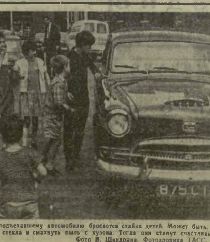
Либервал (Англия). К подьезжавшему автомобилю бросается стайка детей. Может быть, водителю позволят ли протереть стекла и смахнуть пыль с кузова. Тогда они станут счастливыми обладателями пары монет.

Напряженное положение сохраняется и в городе Гуанчжоу и провинции Гуандун на юге Китая. Сообщают, что там произошли новые столкновения между противниками и сторонниками Мао Цзэ-дуна, в которых принимали участие воинские части. (ТАСС).