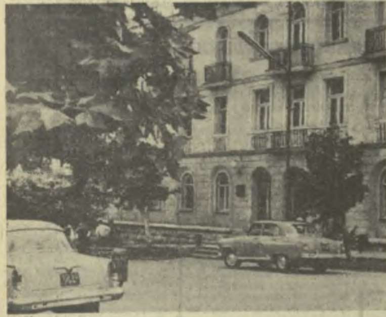
Гурджаани. Здание гостиницы.