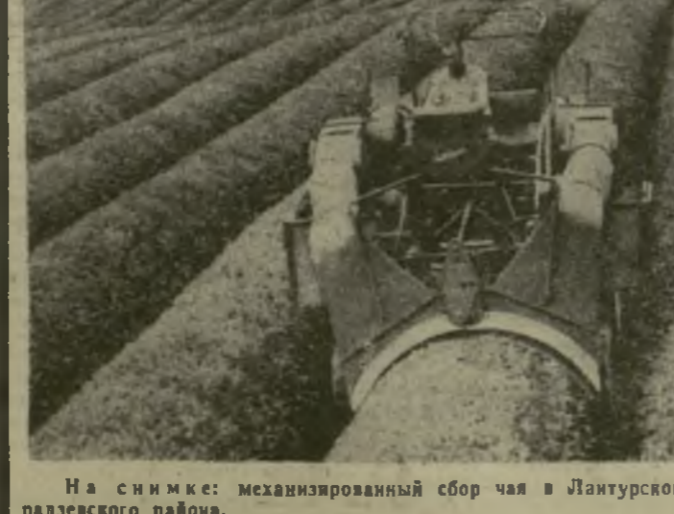
На снимке: механизированный сбор чая в Плантурском чайном совхозе-техникуме Махарадзевского района.