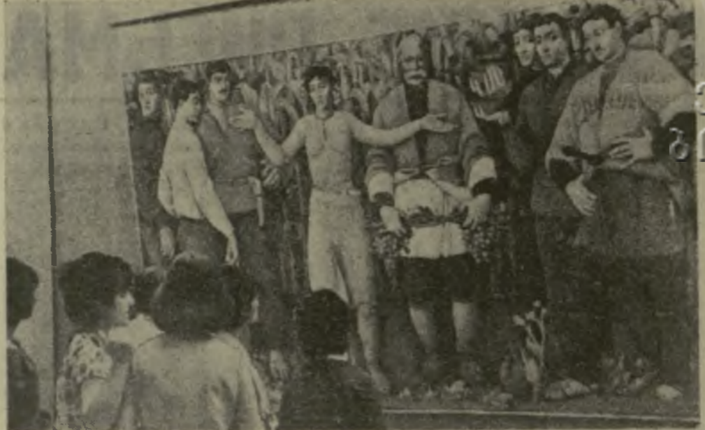
На снимке: посетители выставки у картины заслуженного художника Грузинской ССР К. Махарадзе «Земля грузинская».