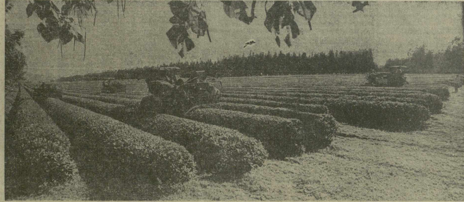
На плантациях Ингрского чайного совхоза Зугдидского района.