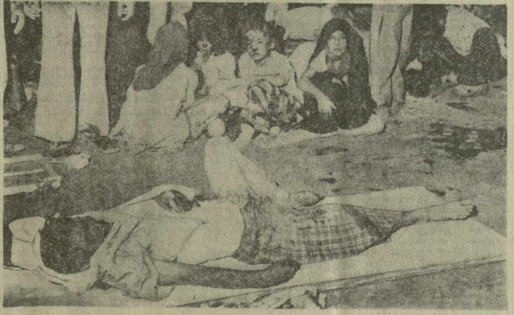
▲ КАК ИЗВЕСТНО, В ИРАНЕ произошло катастрофическое землетрясение, происшедшее в восточной провинции Хорасан, где погибло 40 тысяч человек. Полностью разрушены город Тебес и 40 населенных пунктов. На снимке: в городе Тебес после катастрофы.

более 30 человек ранены, сотни демонстрантов арестованы. В городе Кум произведены аресты среди местного населения по обвинению в нарушении закона о военном положении. В Тегеране сохранялась относительно спокойная обстановка.