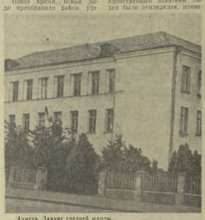
Ахмета. Здание средней школы.