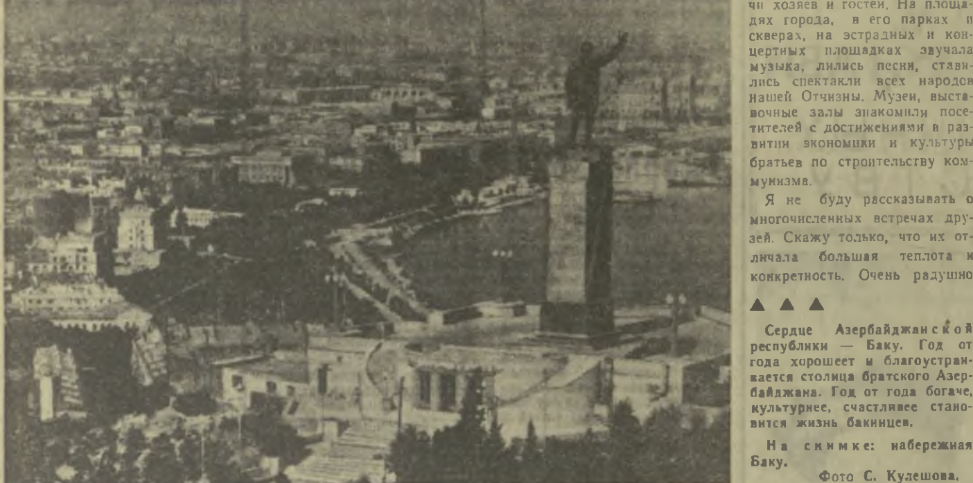
▲ ▲ ▲ Сердце Азербайджанской республики — Баку. Год от года хорошеет и благоустривается столица братского Азербайджана. Год от года богаче, культурнее, счастливее становится жизнь бакинцев. На снимке: набережная Баку.

Вместе с представителями рабочего класса, колхозного крестьянства и интеллигенции в Азербайджан на праздник дружбы приезжали мастера искусства братских народов. На фабриках и заводах, промыслах, на стройках, в колхозах и совхозах, в школах и вузах состоялись задуманные встречи хозяев и гостей. На площадях города, в его парках и скверах, на эстрадных и концертных площадках звучала музыка, лились песни, ставились спектакли всех народов нашей Отчизны. Музеи, выставочные залы знакомили посетителей с достижениями в развитии экономики и культуры братьев по строительству коммунизма.