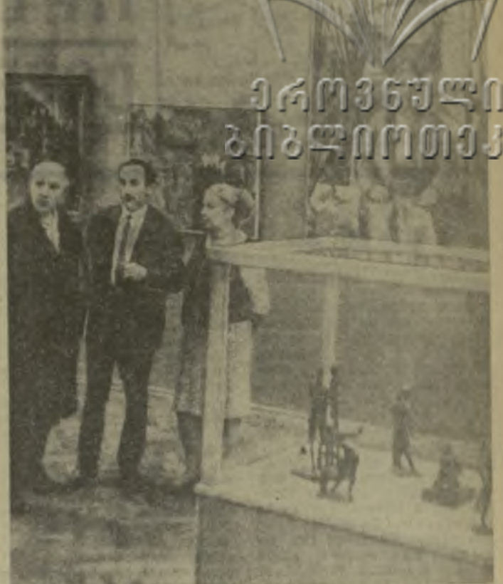
На снимке: один из уголков венгерской выставки изобразительного искусства в помещении Академии худо- жеств.