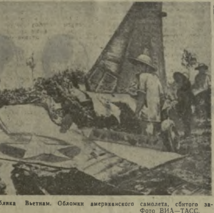
Демократическая Республика Вьетнам. Обломки американского самолета, сбитого заштанниками Ханоя.