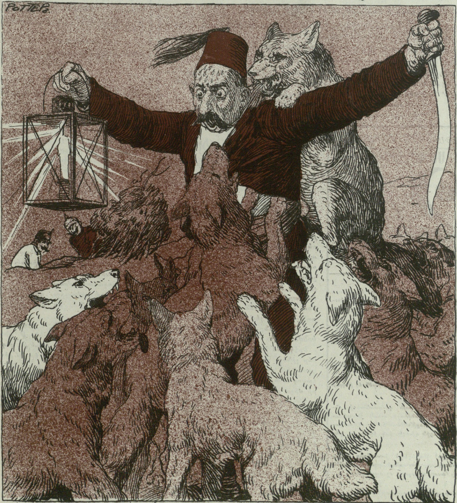
Փրկութեան ճանապարհը ես ո՞րտեղ գտնեմ.