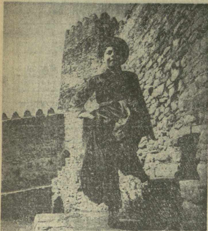
На снимке: юный танцор детского хореографического ансамбля.