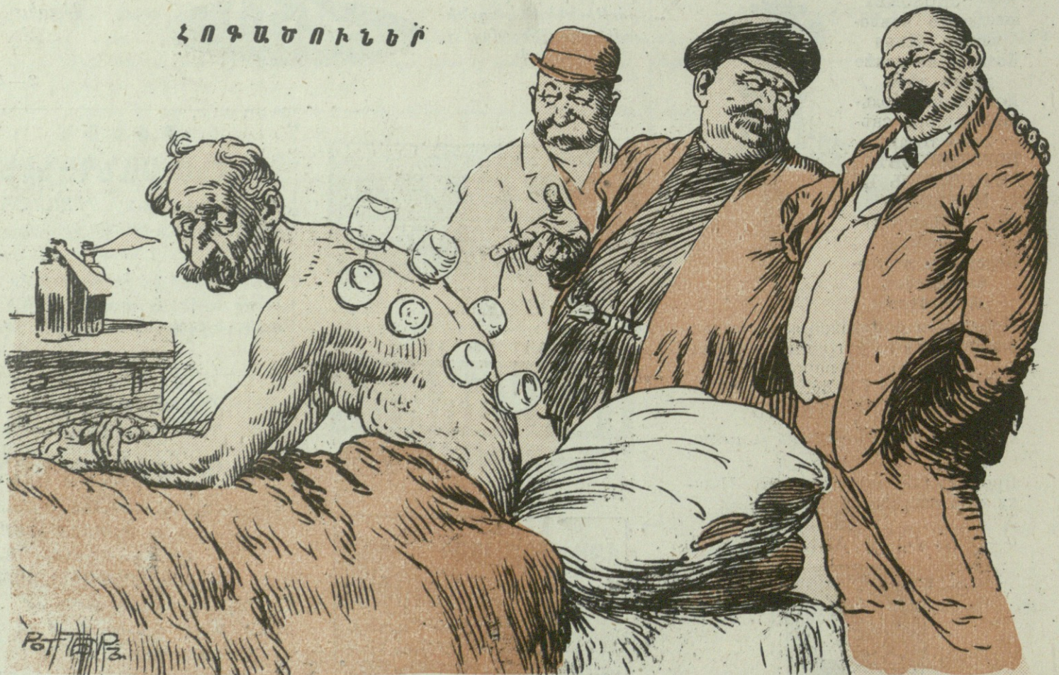
Մեր զիւղացու համար, ասում են, թէ բանկեր են հարկաւոր, նրան՝ վաշխառուներից զերծ պահելու համար. այժմս ինչ կատէք. արդեօք սրանք յարմար բանկեր չեն, ինչ անենք թէ բանկաներ են: —Կատարեալ բանկեր են.