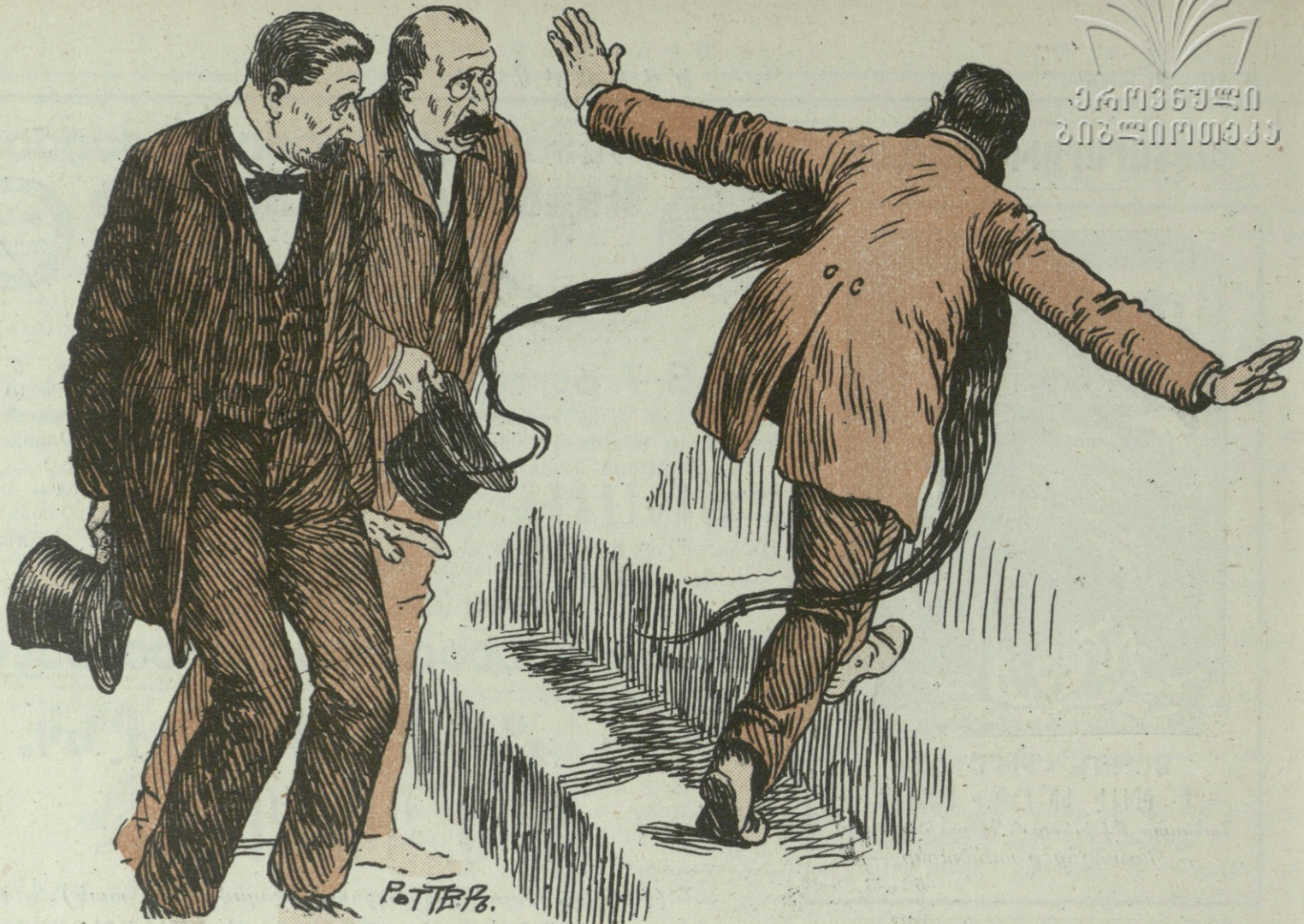
—Մենք ցանկանում ենք տօնել ձեր գործունեութեան քառասնամակը. —Ձեռք վեր առեք, ի սեր Աստու ինձանից, ուզում էք ինձ մի լաւ հայեոյ՛ջք, ու պատճառը 40 ամեայ գործունեութիւնն էք բերում. լաւ եմ ձանաչում հայերիդ. մի նաչ էք տալի, հարիւր անգամ օխաղ պարտը հայեոյում էք. չեմ ուզում: