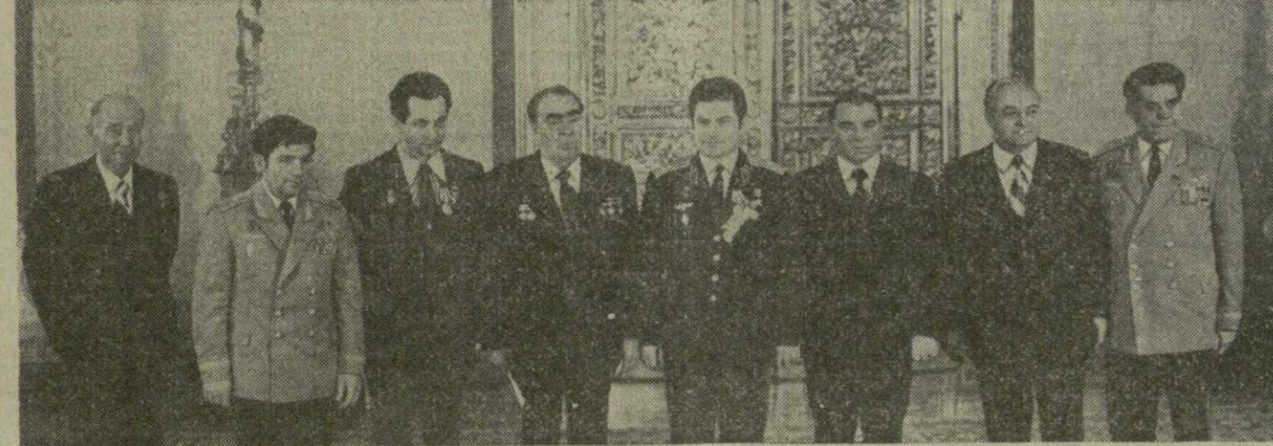
На снимке: при вручении наград.