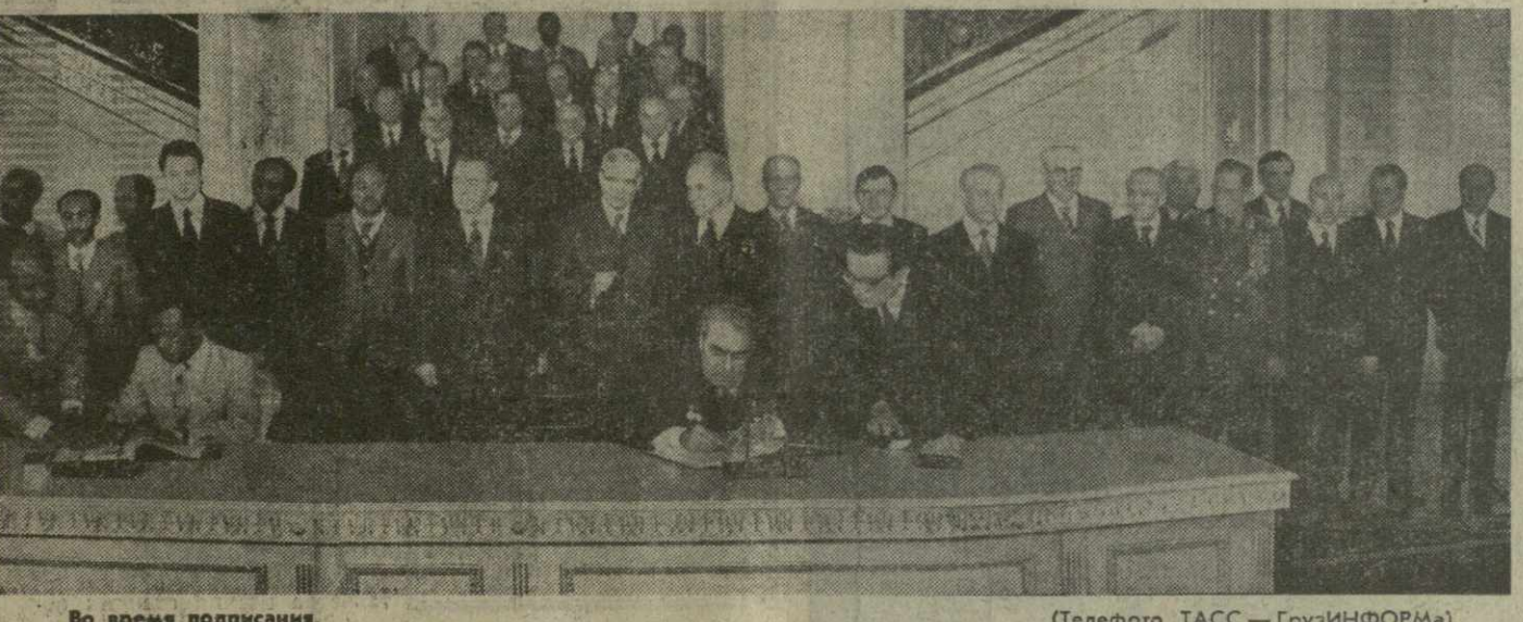
Во время подписания.