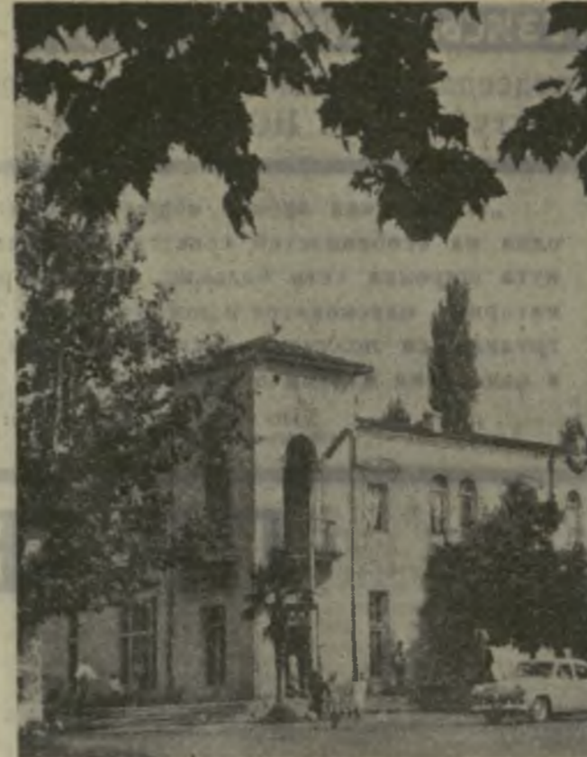
На снимке: один из уголков Чохатаури.

Растут урожай, растут доходы хозяйств, изобилие и достаток в доме каждого труженика Чохатаурского района.