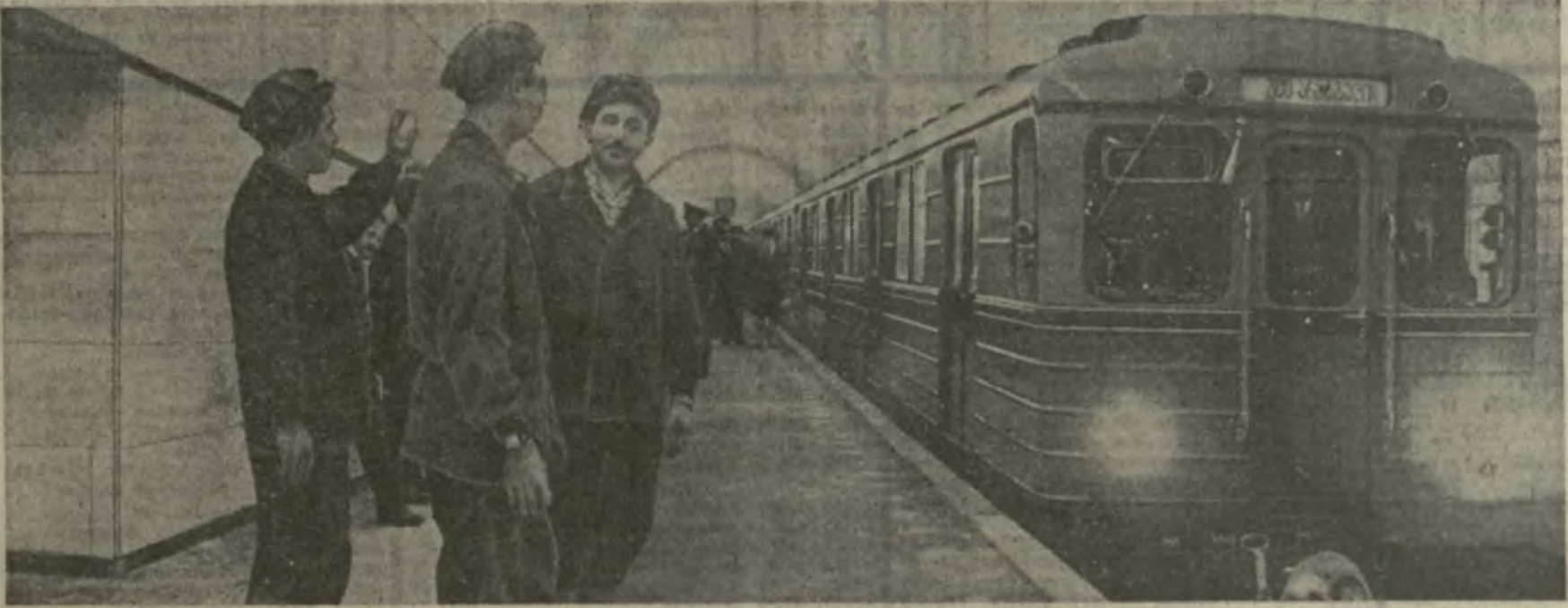
На снимке: пробный электропоезд прибыл со станции «Площадь Руставели» на новую станцию метро — «300 арагвицев».