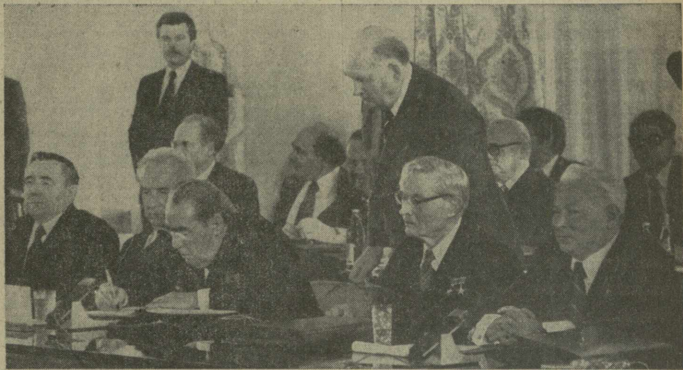
Подписание Декларации государств — участников Варшавского Договора Генеральным секретарем ЦК КПСС, Председателем Президиума Верховного Совета СССР товарищем Л. И. Брежневым.