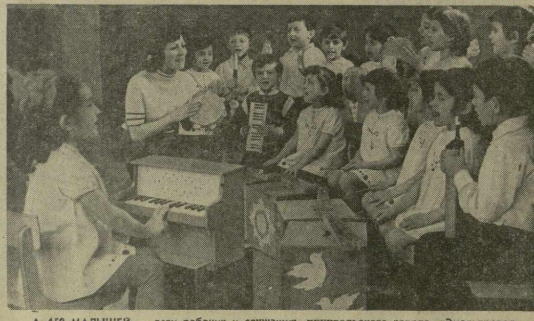
▲ 150 МАЛЫШЕЙ — дети рабочих и служащих цехивальского завода «Эмальпроvoz» с удовольствием посещают детский сад предприятия. На снимке: музыкальный час в одной из групп детского сада.

В. БЕРИДЗЕ, директор Института истории грузинского искусства, академик Академии наук Грузинской ССР.