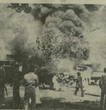
На снимке: на улице Тегерана во время антиправительственных выступлений.

В иранской столице снова имели место массовые антиправительственные выступления и демонстрации.