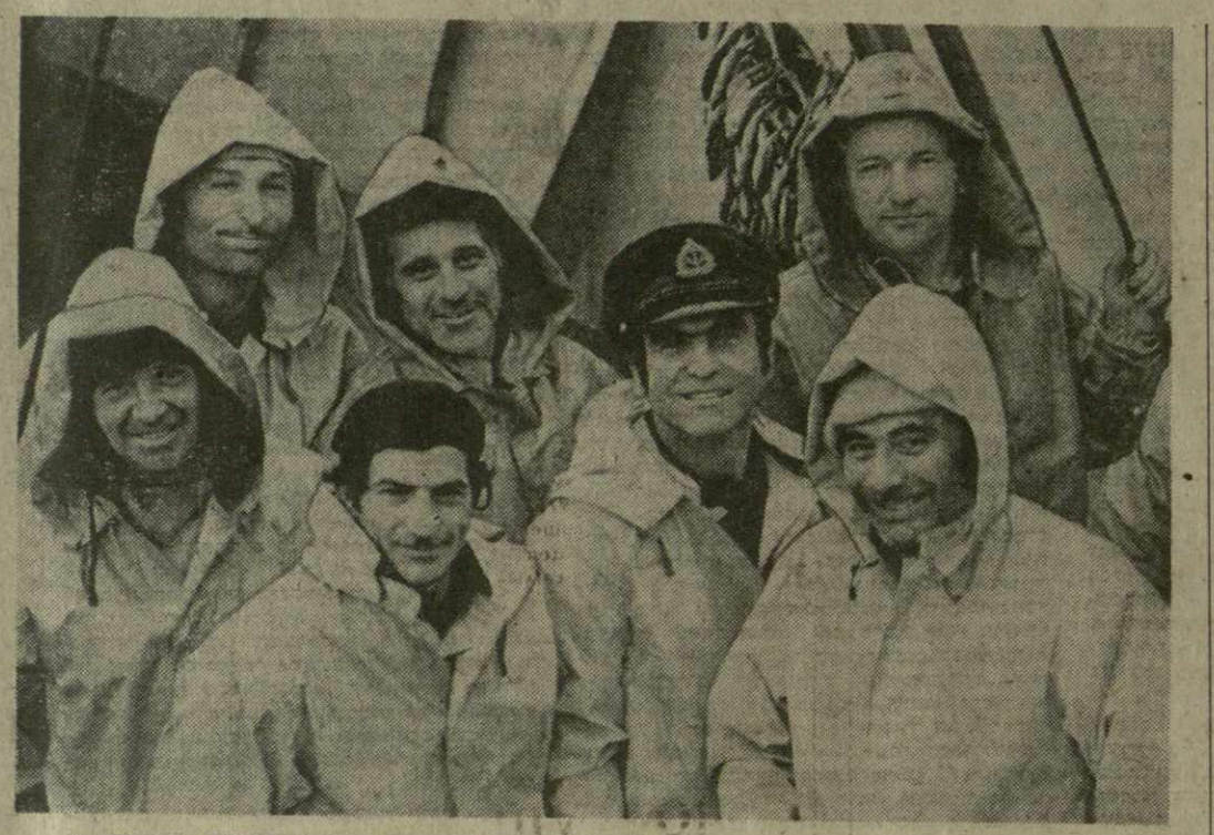
СОТНИ ТОНН черноморского анчоуса вылавливают ежедневно промысловые суда, ведущие лов у берегов Аджарии.