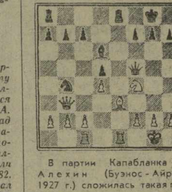
В партии Капабланка — Алехин (Буэнос-Айрес, 1927 г.) сложилась такая позиция.

Сегодня мы рассмотрим один из типичных мотивов «последняя горизонталь». Если на доске сохранились тяжелые фигуры, то положение короля за собственными пешками, стоящими на первоначальных позициях, может оказаться очень опасным.