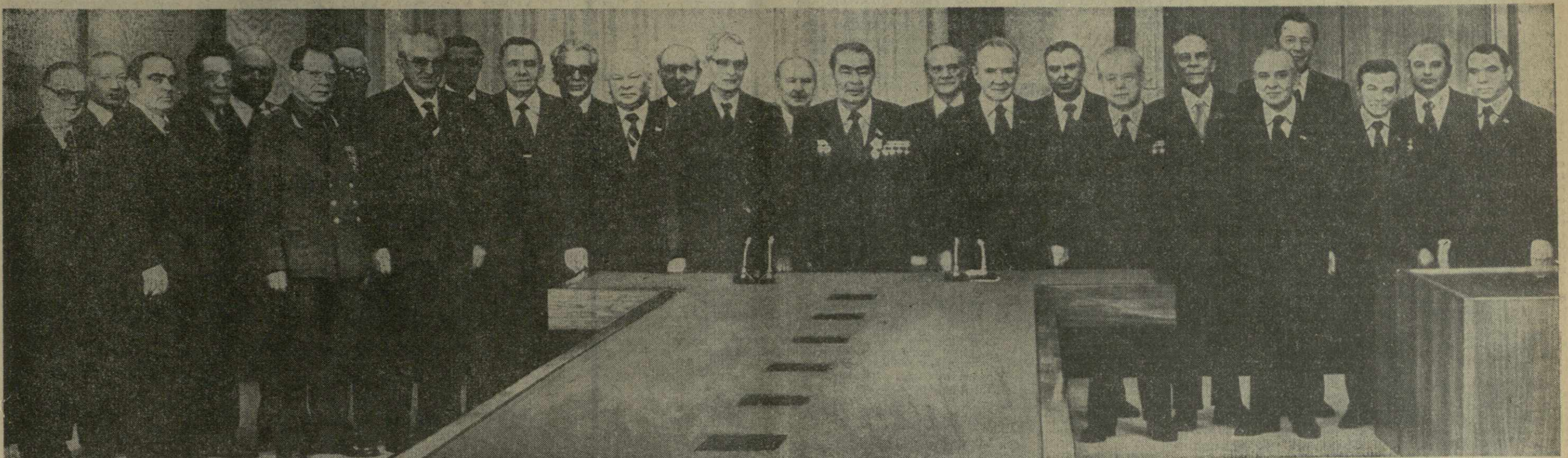
Во время вручения наград.

Первый заместитель Председателя Президиума Верховного Совета СССР В. КУЗНЕЦОВ. Секретарь Президиума Верховного Совета СССР М. ГЕОРГАДЗЕ. Москва, Кремль, 19 декабря 1978 г.